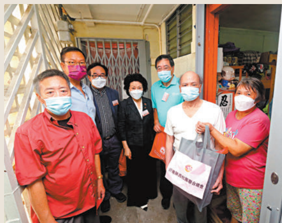
◆港區省級政協委員聯誼會舉辦「慶香港回歸祖國25周年福袋送暖探訪行動」。

是次活動由南區康樂體育促進會主辦，香港南區各界慶祝香港回歸祖國25周年活動籌委會合辦。據介紹，籌委會以「南區節」為題，分為文化、藝術、體育、健康四大系列活動，在「七一」期間將舉辦46場豐富多彩的慶回歸25周年系列活動，與全港市民共同歡慶回歸。其中，今次配合「南區節」體育元素所展開的慶祝活動還包括南區青少年3×3回歸盃籃球賽、草地滾球比賽、沙灘跑等。