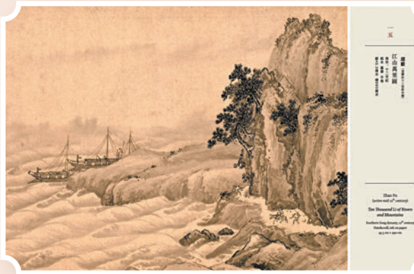
▲趙孟頫《江山萬里圖》內文版式。