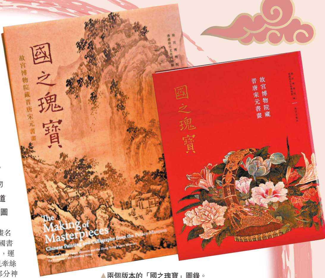
▲兩個版本的「國之瑰寶」圖錄。

圖冊還對參展書畫進行了詳細而完整的內容著錄，包括每件作品中的全部文字和印章的釋文、題跋書寫者和鈐印收藏者的身份，