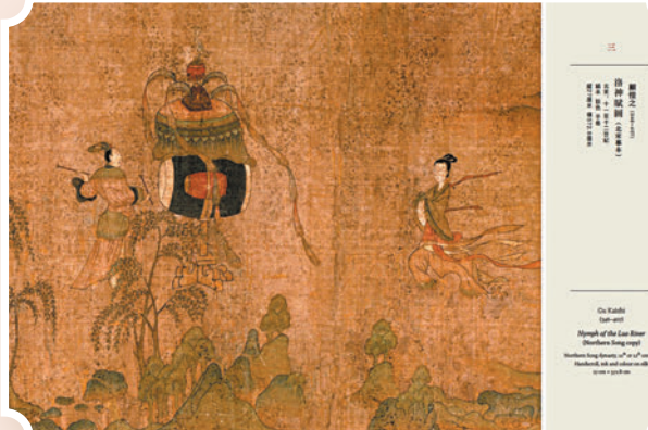
▲顧愷之《洛神賦圖》(北宋摹本)內文版式。