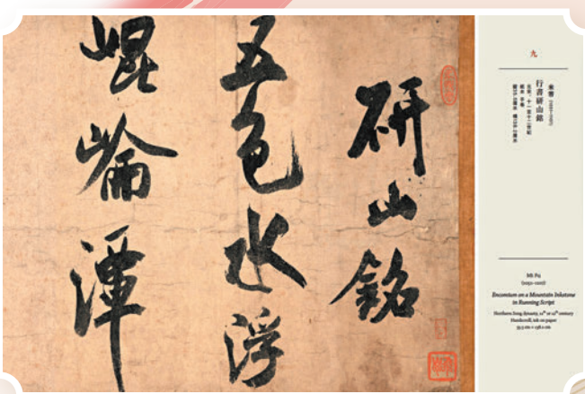
▲米芾《行書研山銘》內文版式。