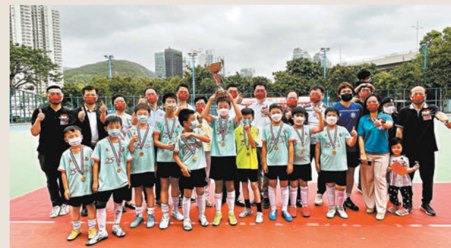
◆來自南區的大人和小朋友在球賽中歡慶回歸。

香港文匯報訊(記者 子京)「慶祝香港回歸25周年南區體育系列啟動禮暨四分區足球比賽」日前在鴨脷洲公園足球場舉行，來自南區的大人和小朋友一同參與，在足球賽事中歡慶回歸25周年。