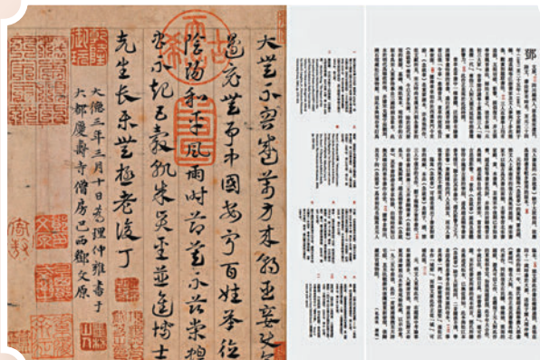
▼鄧文原《章草書急就章》內文版式。