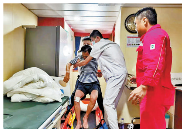
◆內地工程船「福景 001」獲救甲板工。

香港文匯報訊（記者 蕭景源、盧靜怡）內地工程船「福景 001」上周六（2 日）在香港西南約 300 公里海域不敵颶風「暹芭」吹襲，斷為兩截沉沒，香港特區政府飛行服務隊及時救起 3 人，另外 27 人則告失蹤。由粵港兩地組成的搜救行動進入第三日，廣東省海上搜救中心昨宣布再成功救起 1 人，令海難生還者增至 4 人。在距離沉船約 50 海里水域，搜救人員尋獲 12 具懷疑是墮海失蹤船員遺體，惟身份仍有待確認。聯合搜救行動仍在進行，搜救人員將進一步擴大搜索範圍，全力搜救失蹤船員下落。