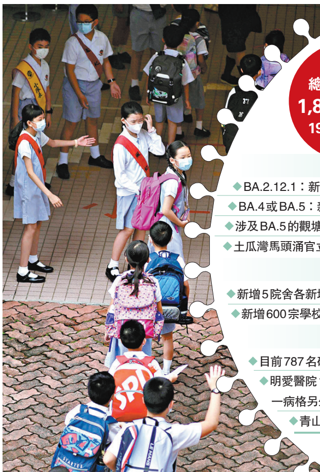
◆土瓜灣馬頭涌官立小學 6C 班昨日呈報有 3 名學生、1 名老師感染。圖為土瓜灣馬頭涌官立小學，學生在復課時重返校園。資料圖片

另外，明愛醫院一名女病人周日經入院篩查後確診，她入住的內科病房同一病格兩名女病人其後亦確診，5 名病人列為密切接觸者要檢疫，病房暫停接收新症。青山醫院法醫精神科男病房則多 3 名病人確診，至今有 4 名病人及 3 名職員中招，醫院已採集環境樣本化驗。