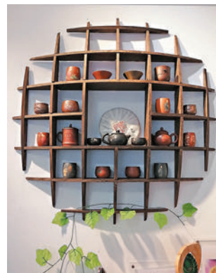
◆展覽設計帶有禪意

展覽詳情 地點：香港德輔道中254-256號金融商業大廈8樓01室(瑰寶藝博) 預約電郵：Gublear@yahoo.com