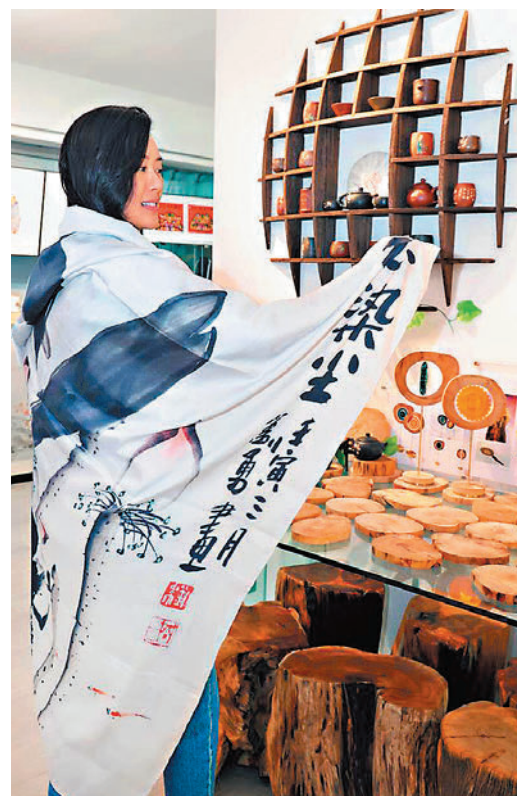
◆劉勇畫的荷花印在絲巾上特別有中國風味道。

香港文匯報訊 中國西部陶都榮縣土陶作品首度在香港「劉勇香港藝術空間」展出，主題為「壺中天地寬，把杯享慢活」，呈現了中國西部陶都榮縣土陶創意園首席藝術家及畫家劉勇(一澄)的茶畫及各種陶瓷作品。劉勇的陶瓷作品包括景德鎮青花、雲南建水紫陶、四川榮縣土陶等，作品內容快樂陽光，積極向上，傳統功底扎實，正能量滿溢，據介紹，這次他呈現的產自榮縣土陶的創意作品又為香港觀眾帶來不少驚喜。