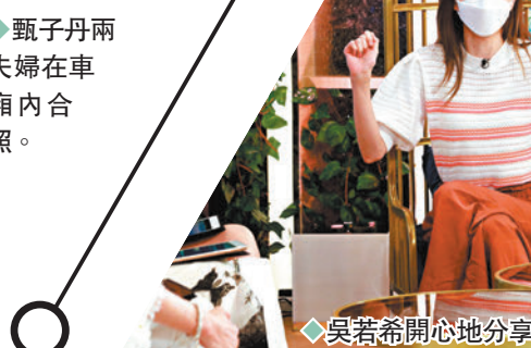
◆吳若希開心地分享育兒心得。