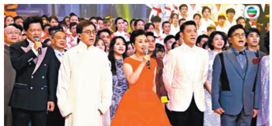
◆《慶祝香港回歸祖國二十五周年文藝晚會》群星雲集。

免費電視頻道直播收視總數28點，觀眾超逾180萬，當中翡翠台跨平台直播收視24.5點，近160萬觀眾，佔88%，高踞上週節目收視第一位，成績驕人！