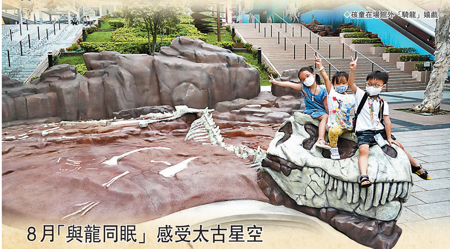
孩童在場館外「騎龍」嬉戲。

發掘年份及地點：2008年至今，摩洛哥卡馬卡瑪層 簡介：為1:1原大比例復原骨架模型，背部有高大鱗狀帆，尾巴呈槳狀，口與鼻部幼長