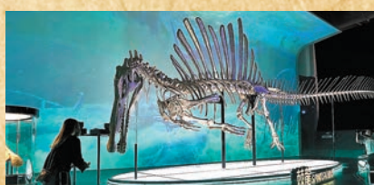
棘龍 Mister Big

發掘年份及地點：1999年，美國懷俄明州豪威採石場 簡介：全球現存最完整的幼齡長頸恐龍標本，幼齡的Toni在短短數秒間被掩埋，因此其骨骼化石非常清晰，保存良好