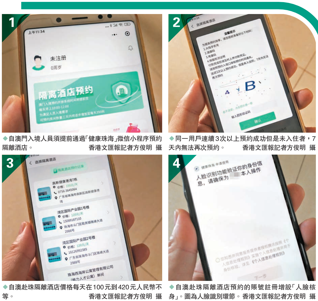
◆自澳門入境人員須提前通過「健康珠海」微信小程序預約隔離酒店。香港文匯報記者方俊明攝 ◆同一用戶連續3次以上預約成功但是未入住者，7天內無法再次預約。香港文匯報記者方俊明攝 ◆自澳赴珠隔離酒店價格每天在100元到420元人民幣不等。香港文匯報記者方俊明攝 ◆自澳赴珠隔離酒店預約的賬號註冊增設「人臉核身」。圖為人臉識別環節。香港文匯報記者方俊明攝

「從澳門到珠海可以用人臉識別，為什麼入境深圳不用這種方式？」深港跨境人士陳先生受訪時表示，健康驛站的註冊雖然是實名制，但是登錄沒有要求和限制，這就給黃牛有可乘之機，限制IP登錄的方式並沒有辦法從根本上解決這一問題。深圳健康驛站系統應借鑒珠海實行人臉識別登錄功能，非常有效，因為黃牛無法登陸就沒有辦法搶名額。跨境家庭溫先生亦表示，現時除了增加健康驛站的預約名額，加大力度打擊「黃牛黨」的炒賣活動更為重要，從登錄源頭嚴防，較事後再追擊會更為有效。