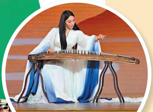
◆2018年袁莎參加中非論壇文藝演出，領奏《武動靈韻》。