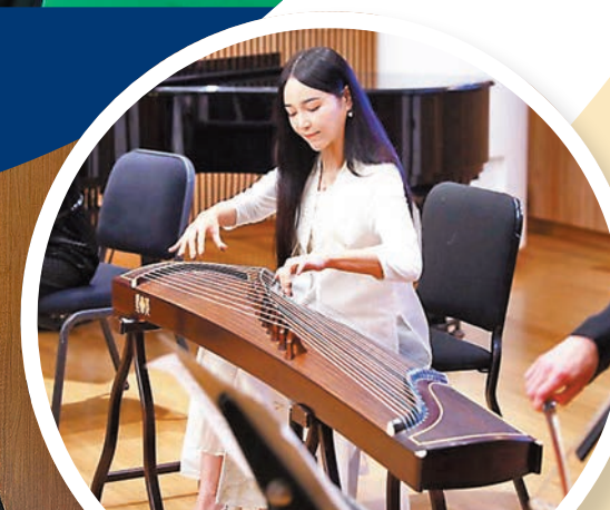
◆袁莎在紐約林肯藝術中心巡迴講座音樂會演奏。