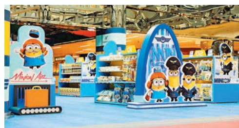
期間限定迷你兵團精品店