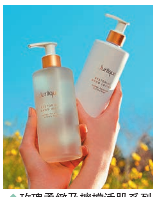
玫瑰柔嫩及檸檬活肌系列

現在大家常以搓手液搓手，或許手部會變得粗糙，因此居家要做好手部護理。護膚品牌Jurlique推出全新玫瑰柔嫩及檸檬活肌系列，選用萃取自南澳自家活機農場的純淨滋養植物精華，其潔手液和護手乳蘊含兩種天然的精油成分，讓潔手添上香薰芳療的感覺。