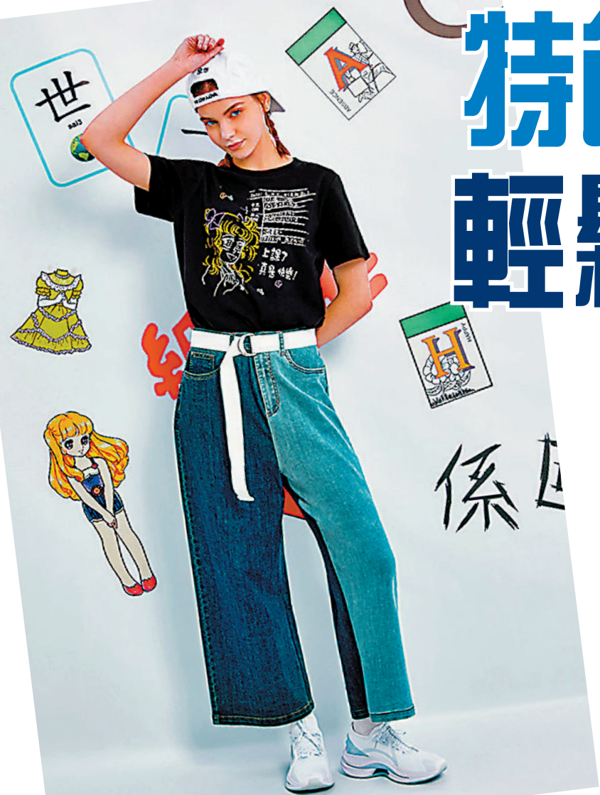
香港懷舊文化系列