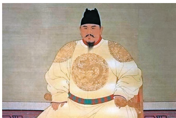
藍玉雖然是明朝開國名將，但最終被朱元璋所殺。圖為朱元璋畫像。資料圖片

洪武26年，錦衣衛指揮蔣獻告發藍玉謀反。查到他聯同一公、十三侯、二伯，預備乘皇帝出獵時舉事。