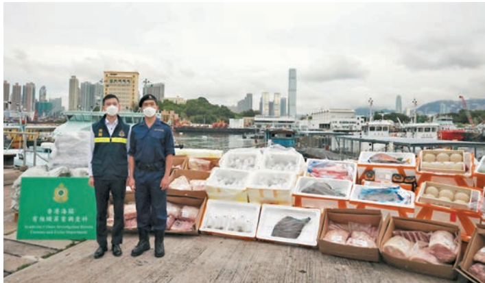
◆海關在反走私行動中檢獲的物品包括和牛、海鮮和蔬果等。

中。 海關將繼續追查該批走私貨物的源頭，包括貨船的擁有人是否涉案等，不排除會有更多人被捕。