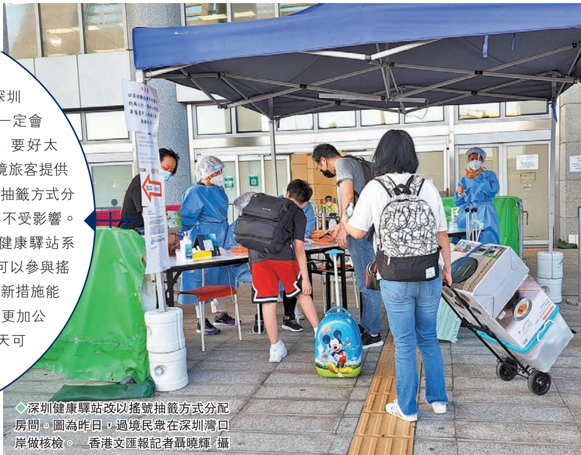
◆深圳健康驛站改以搖號抽籤方式分配房間。圖為昨日，過境民衆在深圳灣口岸做核酸。香港文匯報記者攝

香港文匯報訊（記者 郭若溪 深圳報道）「用搖號的方式儘管中籤率不一定會很高，但已經比之前每日搶票『秒光』要好太多。」7月10日，深圳市政府公布，為入境旅客提供隔離醫學觀察的健康驛站，即日起改以搖號抽籤方式分配房間，此前已成功預訂健康驛站的旅客則不受影響。新措施規定，入境人員需先將資料申報到健康驛站系統，待審核符合資格條件，只要合資格就可以參與搖號抽籤。不少計劃近期預約的港人表示，新措施能有效打擊猖獗的「黃牛」黨，讓大家能更加公平地獲得驛站名額。同時，每人每天可申報未來6天的名額。