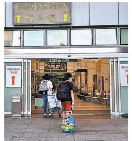
◆深圳灣口岸過境民衆進入核檢結果等候區。