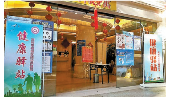
◆深圳入境人員需將資料申報到健康驛站系統，參與搖號抽籤。圖為早前深圳一間健康驛站隔離酒店。

根據規定，深圳市將會根據酒店的剩餘數量分配搖號名額，深圳灣口岸入境旅客須提前預約通關，系統彈性設置每日搖號抽籤名額約2,000個。旅客需自行到「健康驛站房間線上預約系統」，填寫姓名、手機號碼、最終目的地等個人資料。待系統審核後，旅客可在每天上午9時至下午6時期間，參與下一期搖號，報名時可實時查看未來6日的可用抽籤名額及已報名人數。