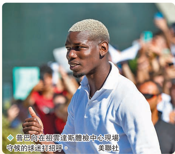
普巴向在祖雲達斯體檢中心現場守候的球迷打招呼。

最佳中場之一，不過2016年以9,000萬英鎊高價加盟曼聯後表現卻一直與外界期望有落差，更成為球迷眼中曼聯近年「四大皆空」的罪人之一；而普巴則解釋自己在曼聯不受尊重，情緒亦受到困擾，會在祖雲達斯重新證明實力。