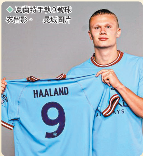
夏蘭特手執9號球衣留影。

香港文匯報訊 (記者 梁志達) 被視為新生代未來「球王」接班人的挪威新秀夏蘭特，今夏強勢加盟曼城後被視為英超又一顆超級球星。而在昨天，他在新球會的球衣號碼亦終於揭盅，所選擇的是傳統前鋒位置的9號戰袍。 艾寧夏蘭特在舊東家多蒙特和挪威國家隊所穿的都是9號球衣，「我很高興再次獲得9號戰袍，這是每個前鋒都渴望的球衣，而在世界上其中一家最好的球會穿上它更是夢想成真。」艾寧夏蘭特在球會專訪中表示：「在過去的兩年裏，