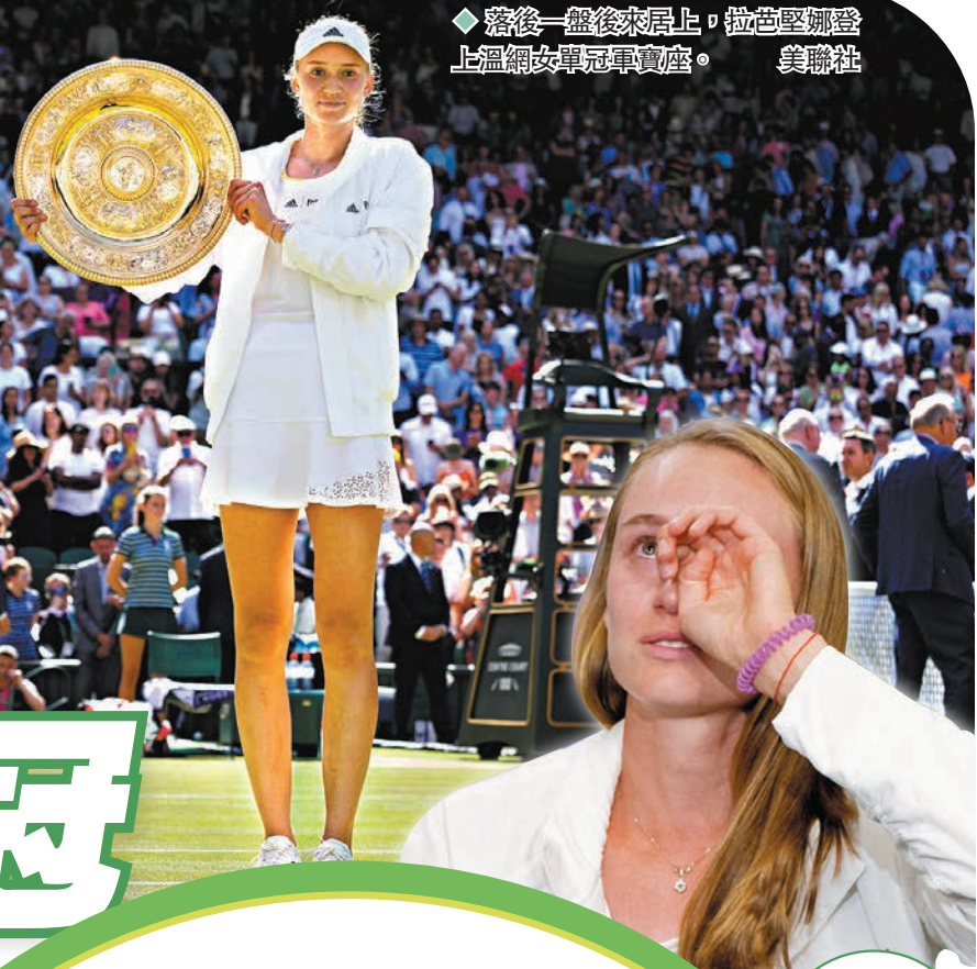
落後一盤後來居上，拉芭堅娜登上溫網女單冠軍寶座。