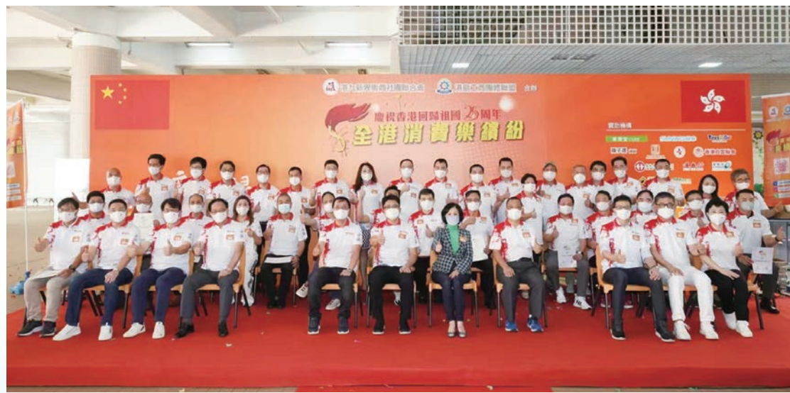
◆慶祝香港回歸祖國25周年暨全港消費樂繽紛啟動禮合影。

香港特區政府慶祝回歸祖國25周年系列活動之一，由港九新界販商社團聯合會和港島工商團體聯盟合辦的「全港消費樂繽紛」慶祝活動於7月1日至31日在全港各大街市同步開展。共有超過3,000商戶參與此計劃，並向市民提供購物福利，市民到店出示活動QR code，便可獲得優惠，預計受惠人數超過200萬人次。