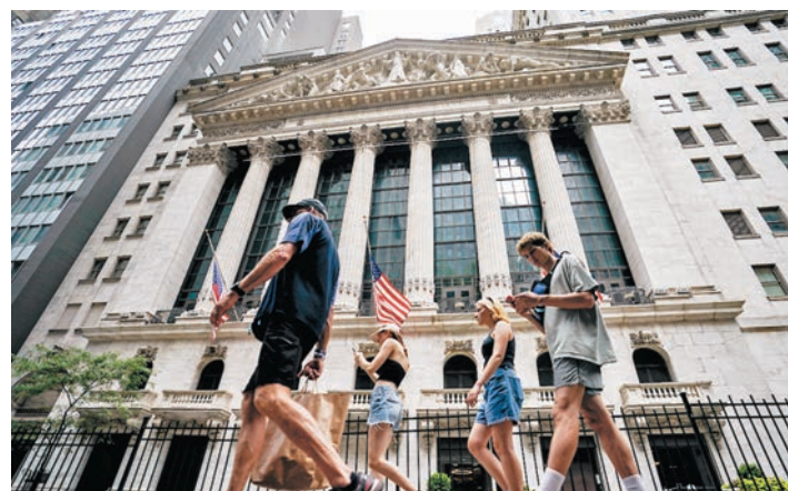
◆市場趨於波動，建議可聚焦高股息與具防禦性的部位，以降低投資組合波動。圖為美國紐約證券交易所。資料圖片

美國聯儲局官員看好美國經濟軟着陸前景，並支持以貨幣政策抑制通脹，市場對經濟的擔憂略有改善，但全球股市資金流向仍分歧。根據美銀引述EPFR統計顯示，過去一周包括美國與亞洲（不含日本）股市迎來資金淨流入，其餘如已開發歐洲、非洲、中東、拉美及全球新興市場股市資金則呈淨流出狀態。 ◆安聯投信