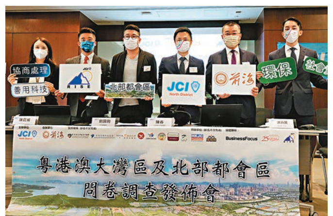
◆98%受訪者支持發展「北部都會區」。

香港文匯報訊（記者 文森）去年底施政報告提出《北部都會區發展策略》後，北區青年商會昨日發表調查，98%受訪者支持發展「北部都會區」，認為有助改善香港房屋短缺問題，及提供創科產業發展空間等。香港文匯報昨日訪問兩位