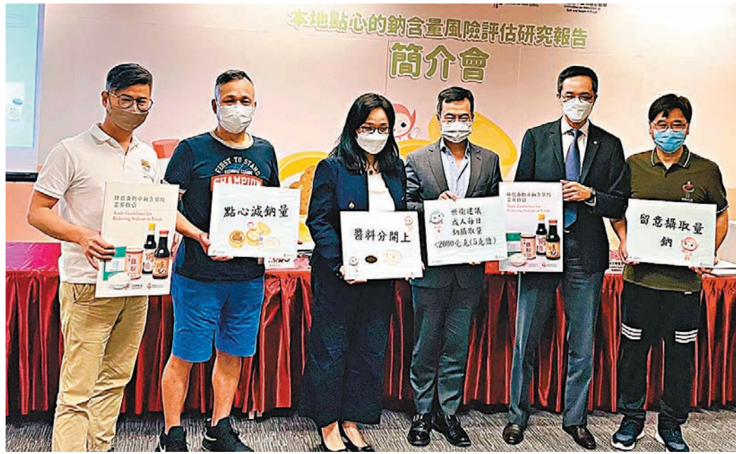
◆食安中心公布12款點心鈉含量的化驗結果，與10年前同類研究相比，鈉含量有下降趨勢。

食安中心早前從不同中式食肆和點心店收集12款點心，共120個非預先包裝食物樣本及4款醬料樣本，經化驗研究分析的結果顯示，所有點心樣本每100克食物含3毫克至680毫克鈉不等，平均鈉含量為330毫克，相比中心2012年同類研究的11款點心，今次有9款點心的鈉含量有所降低，反映市面點心的鈉含量呈下降趨勢。 在各款點心中，平均鈉含量最高的是蝦肉燒賣（平均每100克含590毫克鈉），其次是鮮蝦春卷（平均每100克含480毫克鈉）和牛肉球（每100克含440毫克鈉），而平均鈉含量最低的點心則是齋腸粉。120個樣本當中有7個樣本屬「高鈉」。