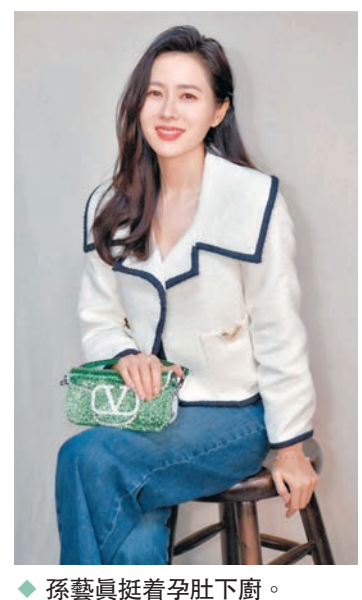
孫藝真挺着孕肚下廚。