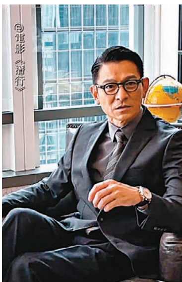
華仔不僅擔任片中主角，更擔當了影片監製。

在電影中華仔不僅擔任領銜主演，更擔當了影片監製。近年來，華仔不但演活了《拆彈專家》系列、《失孤》等影片中的經典銀幕形象，更開始參與監製工作。而他監製的電影，如《拆彈專家2》、《掃毒2》等亦獲得票房和口碑的雙豐收。此番出任電影《潛行》的監製，在內容品質上全面把關，也讓這部影片更受影迷期待。