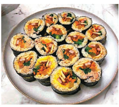
紫菜飯團材料十足。

孫藝真和玄彬因合作韓劇《愛的迫降》而戲假情真，在今年2月宣布結婚，她上個月還宣布了懷孕喜訊。