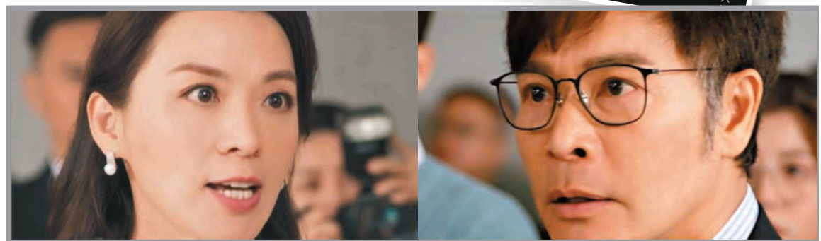
陳煒與郭晉安爭論的場口，看得觀眾好投入。