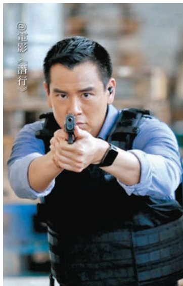
彭于晏演動作片絕不陌生。