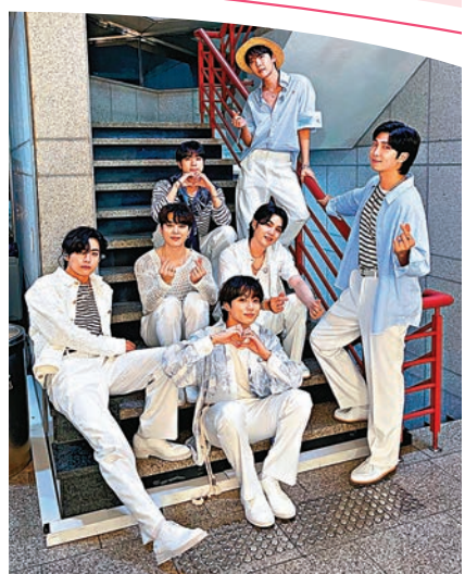
BTS休團後仍不斷推出新項目。

香港文匯報訊 據中央社報道，華特迪士尼公司亞太區和韓國音樂娛樂品牌HYBE昨天宣布推出全球內容合作計劃，包括由HYBE打造在全球發行的5檔重要節目，其中2部為韓國流行男團BTS(防彈少年團)的獨家系列，將在迪士尼串流服務Disney+上線，記錄BTS出道9年來的崛起歷程，還包括7位成員間的私下日常。