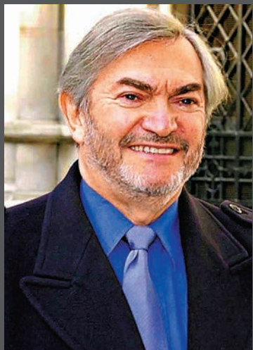
英國作曲家 Monty Norman 因病逝世。

無論如何，這首曲目成了「占士邦」電影不可或缺的一環，接下來24部系列片都可以聽到這個熟悉的旋律。