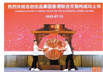
◆回流的名創優品首日跌3%，每手200股賬面蝕84元。

另外，昨日四新股上市，表現不盡人意，集資規模最大的天齊鋁業也未能力挽狂瀾，開市便急挫逾11%，曾低見