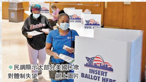
◆民調顯示大部分美國民衆對體制失望。

《紐約時報》與錫耶納學院進行的民調顯示，多數受訪美國選民認為當前美國政府體制失效，58%受訪者更認為，美國民主需要結構性改革或甚至是完全推倒重來，儘管出發點各有不同，但有着這種想法的人遍布所有政治光譜，兼不論年齡、性別或教育程度，顯示對於美國政府及民主制度的失望及求變情緒，已經成為美國人集體共識。同一民調亦顯示，77%受訪者認為美國「正朝着錯誤的方向前進」。