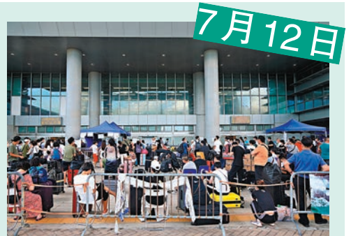
▲深圳灣口岸人山人海，大排長龍。 資料圖片

◀市民只需在預約時段抵達深圳灣口岸，就可以進行檢測。圖為市民排隊等候核酸登記和核酸檢測，小朋友表現雀躍。