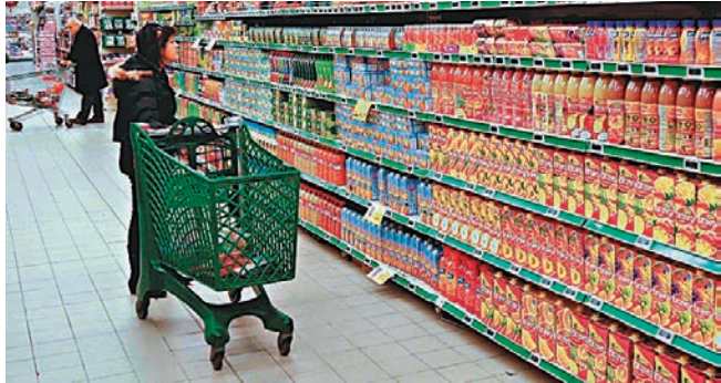
◀ 意大利通脹高企，引發不少民生問題。

意大利政府早前提出一項抗通脹的紓困計劃，執政聯盟成員「五星運動」表示不會參與針對這項法案的信任投票，總理德拉吉因此提出辭職。事件觸發政治危機，可能導致意國提早於今年內大選，總統馬塔雷拉已拒絕德拉吉的辭呈，要求後者致力化解國會分歧，避免提早大選。引發今次危機的導火線，在於「五星運動」就援助烏克蘭和通脹問題與德拉吉存在分歧。一旦執政聯盟倒台，新政府會否仍堅持親歐立場及繼續積極援烏，都存在更大疑問，或影響未來歐盟內部團結。