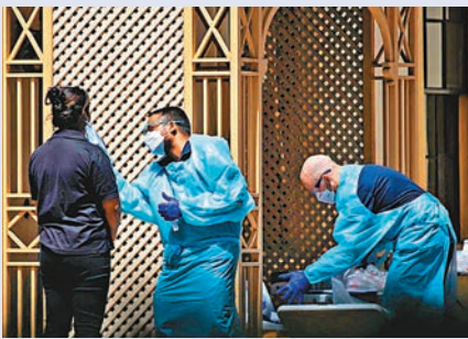
◀ 澳洲護老院職員在院舍外接受檢測。