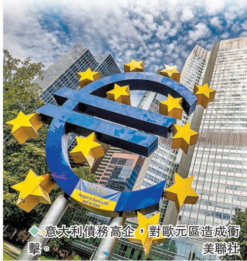
◀ 意大利債務高企，對歐元區造成衝擊。