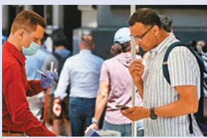
◀ 在BA.5蔓延下，美國疫情持續嚴峻。

隨著新冠變種病毒Omicron的亞型BA.5持續蔓延，美國的疫情大幅反彈，每日確診病例再次升穿10萬宗，過去一周的每天平均死亡個案較前一周大增近一倍。