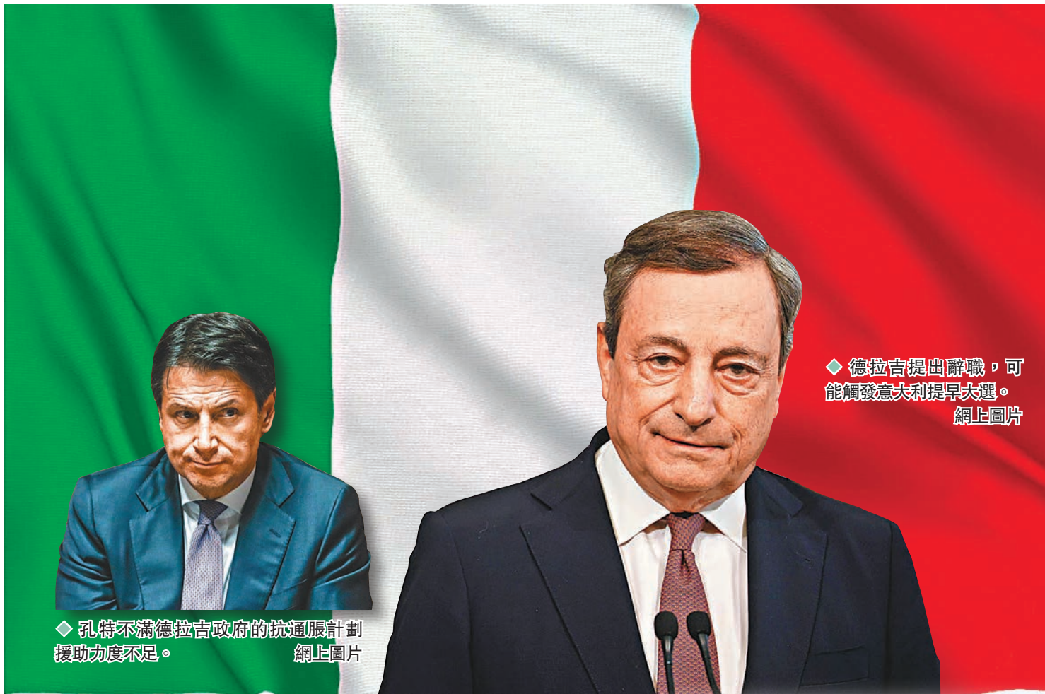
◀ 孔特不滿德拉吉政府的抗通脹計劃援助力度不足。