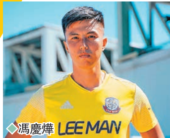
◆馮慶輝 LEE MAN

比賽對國足來說是考驗，因為對手都很強。但是如果提高、想變得更好，則必須跟強隊過招。「每位球員都會有自己防守和進攻的任務。同時要求每位隊員，只要上場就傾盡全力付出所有。不管日本、韓國派出什麼樣的陣容，我們都專注於自己。我們更在乎的是代表誰，我們代表著國家。」揚科維奇又表示，公眾似乎更關注「誰去踢」，但是作為主教練，他會想「怎麼踢」，所以他用了4年時間研發出一套專屬於國足的踢法和系統，會選擇最合適的陣型和最有效的方式來作戰。