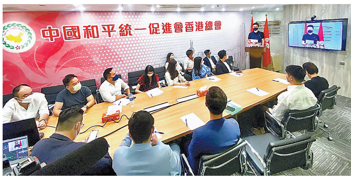
◆ 座談會昨日在香港統促總會會址舉行，採取線上線下同步連線方式進行。

會上，大家一致認為，習主席在重要講話中充分肯定了香港回歸25年以來的卓越成就，精闢論述「一國兩制」重大原則，指明香港未來發展的方向，堅定了香港社會對「一國兩制」的決心和信心，是未來「一國兩制」實踐的指導思想。香港青年作為香港未來的主人翁，定當接好「一國兩制」事業薪火相傳的火炬，助力香港邁進由治及興新階段。