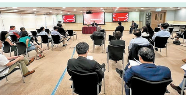
◆ 醫院管理局昨日舉行「國家主席重要講話精神」座談會。

行業需要培訓自家青年軍，如機場管理局成立的香港國際航空學院、港鐵的港鐵學院，以及即將成立的九巴學院等，相信可針對不同程度和志趣的同學需要。