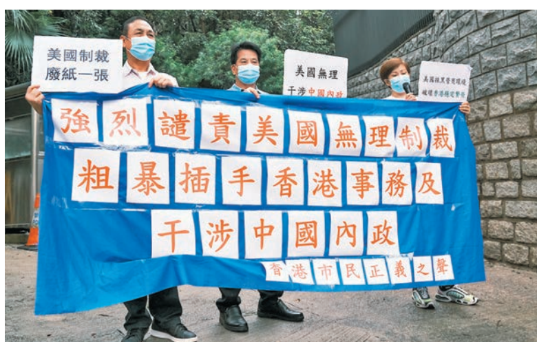
◆圖為有本港團體早前到美國駐港總領事館外強烈譴責美國無理「制裁」，粗暴干預中國香港事務及中國內政。

不過，林定國表示，現時律政司內部較以前更加團結，大家同仇敵愾。他更提到，任何有意加入律政司的人士不用擔心，因為他們的工作十分有意義，「我們會有適當方法，保障他們不會受到任何這方面行動影響。」至於是否公布被點名的檢控人員身份，林定國認為不方便透露，指過去受所謂「制裁」的人士如今也是如常生活。