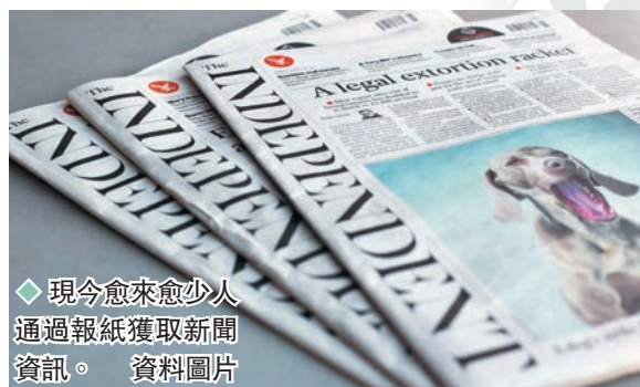
◆現今愈來愈少人通過報紙獲取新聞資訊。資料圖片

美國未來學家艾美·韋比 (Amy Webb) 自2007年起，每年都會發布最新科技趨勢報告。早在十多年前，她已成功預測出多項顛覆性變革，「戰績」包括雲計算、二維碼等。記者出身的韋比曾派駐香港，專長報道科技及經濟新聞，她在趨勢報告也有預測新聞行業的未來。根據她的觀察，業內不論是管理層還是前線，都習慣聚精會神於當下，很少人會去想像五年、十年後的新聞到底會變成什麼樣子。 這也難怪。新聞是歷史的初稿，記者追逐的新聞故事，絕大多數都是已經發生，甚至只是剛剛發生的事情，未發生或者不肯定會否發生的，嚴格來說並非新聞。問題是在科技浪潮之下，讀者閱讀以及消化新聞的習慣急遽改變，新聞機構若繼續停留在舒適圈，恐怕也會變成歷史。 這並非危言聳聽。研究顯示，現今愈來愈少人通過新聞機構提供的載體 (例如網站、報紙) 獲取新聞資訊，更多人接收信息的渠道來自社交媒體以及朋友分享。讀者不再依賴單一資訊來源，但得到的內容很多未經核實，亦更加碎片化。傳播學理論指大眾傳媒可透過報道方向和數量設定議題，今天這功能已大幅削弱，報章頭條的討論熱度，也遠不如網上討論區的熱門話題。 同一時間，用戶在社交媒體上看到什麼或看不到什麼，都是由人工智能和演算法度身訂做，用戶按下每一個Like和Share，都會影響之後同類資訊以及相關廣告出現的頻率。久而久之，與自己意見相近的資訊會不斷重複出現，結果是每個人對事實