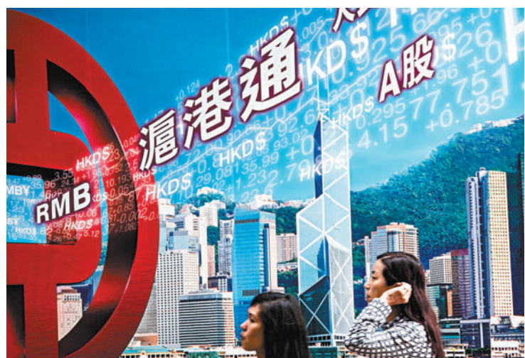
◆截至今年4月，北水淨流入港股逾22,000億港元。

他強調，政府連同監管機構，會持續密切監察市場，堅守香港的金融穩定。他表示，無論面對疫情衝擊或其他宏觀風險事件，當局都有十足信心維護香港貨幣和金融穩定，為國家和全球參與者，提供必要的投融資、定價、風險管理等關鍵的金融服務。