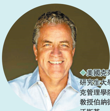
◆美國克萊蒙特研究生大學德魯克管理學院講席教授伯納德·賈沃斯基

當今不少中國企業採用的是源於西方的管理理論。問及西方學者如何看待儒家思想在當代管理學中的應用？賈沃斯基表示，儒家思想中的很多內容和今天是高度相關的，「比如『自我反思』這個概念，今天人們愈發深刻地意識到自省對個人成長乃至企業成長有多重要，而它背後其實涉及更深層次的問題：我，或者一個企業，做些什麼可以更全面地幫助所在的社區（儒學中以家庭為單位，西方以社區為