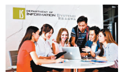
◆城大商學院資訊系統學系與新加坡國立大學首次合作。

另外，學院同步推行「3+1」加速計劃，合資格學生可在完成3年資訊管理學士課程後，直接修讀為期1年的「商務資訊系統」理學碩士課程，即可同時取得由城大資訊系統學系頒發的學士學位和碩士學位。學院最近發布最新調查顯示，超過九成2021年畢業生成功獲聘，平均每月薪金為港幣22,800元，較