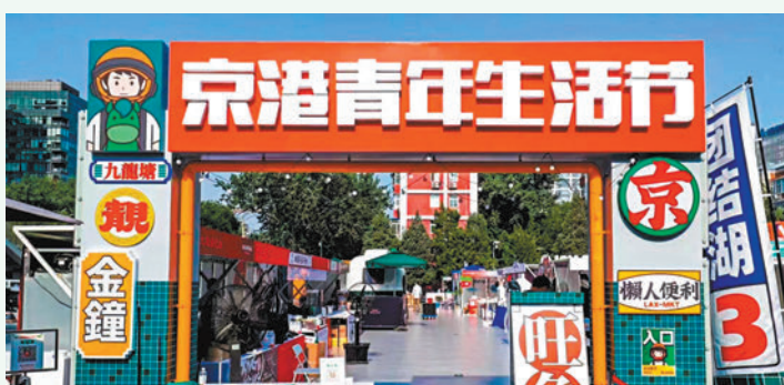
◆三里屯京港青年生活節現場照。

除了即將舉辦的學習活動外，一群在京港人好友們前些日子還在北京的三里屯舉辦了宣傳香港文化的活動。三里屯一帶是北京的名商圈，此處國內外品牌雲集，有很多香港餐廳和企業，從三里屯到國貿又多港人居住。