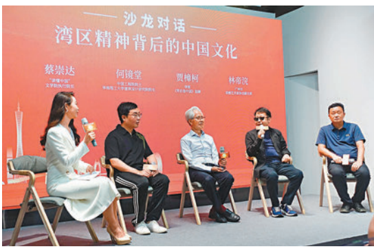
◆發布會本月15日下午在廣州舉行。

賈樟柯在發布會上表示，大灣區是一個充滿想像力的區域，從不同灣區建設者的視角出發，可以看到大灣區的不同側面。賈樟柯希望《背後是中國》是一個高效率的敘事，讓人們在幾分鐘的時間裏面了