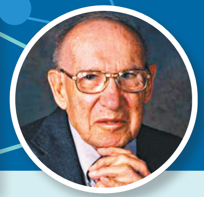
◆現代管理之父 Peter Drucker 資料圖片

金法則)」。他表示，這是超越時空的行為法則，對今天的企業管理仍然適用，「但在我看來，儒學核心原則中最重要的一條是培養學習能力。」一個具有比競爭對手更快更強學習能力的企業，其本質就是「以市場為導向的企業」：了解市場動向並將其帶回本部，將信息轉化為有商業意義的見解和知識，並據此採取行動，所以儒學中的「學習」不僅是獲取信息的過程，還是學習如何改進實踐，甚至學習如何學習，這是競爭優勢的重要來源。他指出，今天的中國公司擁有的最強大的競爭優勢之一就是學習，這是中國管理者身上非常顯著的特點，「他們常常提出很好的問題，而一些西方管理者反而急於得到解決方案，而非思考。」