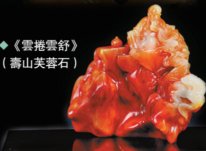
◆《雲捲雲舒》 (壽山芙蓉石)