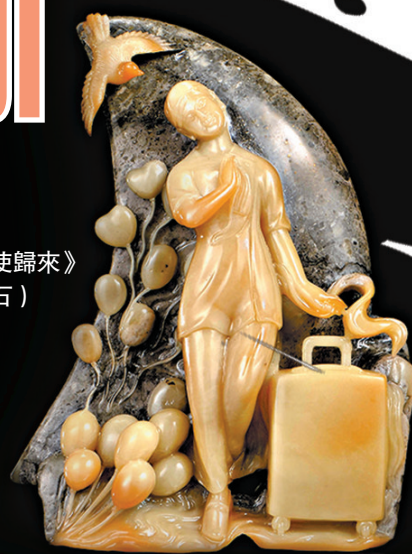
◆作品《天使歸來》 (壽山芙蓉石)