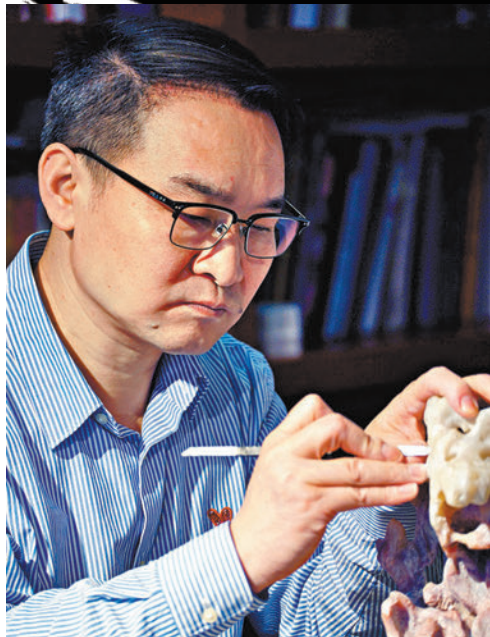
◆在人物雕刻題材中，中國工藝美術大師鄭幼林善於用圓雕與高浮雕相結合的手法，通過簡潔的人體輪廓和線條，來表現人物內在的精神氣質。