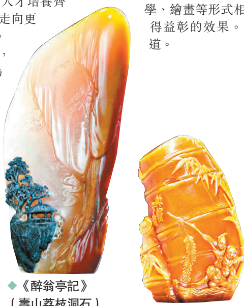
◆《醉翁亭記》 (壽山荔枝洞石)