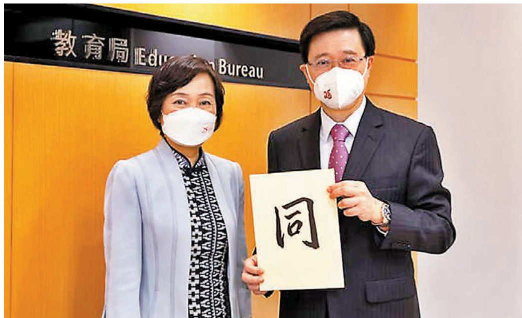
◆蔡若蓮日前發起「一人一字勉考」活動，行政長官李家超率先響應。

招收香港中學文憑考試學生計劃」，同學可直接用文憑試成績報讀約130所參與計劃的內地院校。局方亦透過「內地大學升學資助計劃」，為在內地升學港生提供資助。「我們深信『條條大路通羅馬』，只要你有奮發向上的心志，願意不斷努力，懂得靈活應變，無論你要按原定路線出發，抑或另覓出路，同樣可以踏上成功路！」