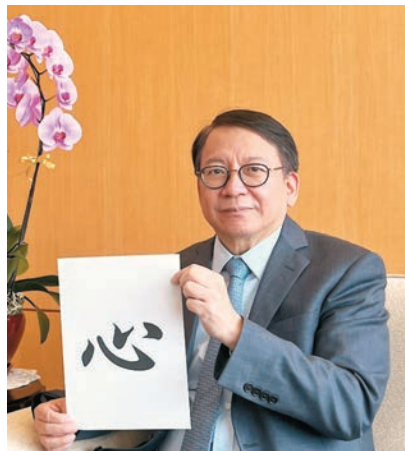
◆陳國基（左）以「心」字勉勵考生，陳茂波（中）以「恒」字提醒考生「恒者，行遠」，林定國（右）則向考生送上「過」字。

林定國向考生送上「過」字，希望同學明白和理解文憑試只不過是漫長人生的一個過程，很快會過去。「無論成績如何，大家都一定要繼續向前看，