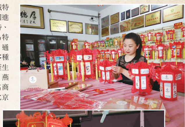
◆「工藝紙雕宮燈」集中國民間工藝、吉祥文化於一身, 極具民族特色。