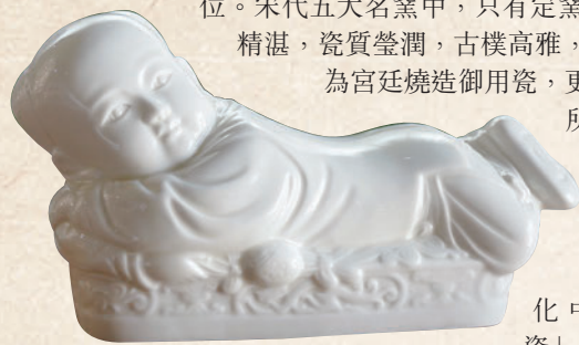
◆定窯孩兒枕——文物, 是九大鎮國之寶之一, 現於香港故宮文化博物館展出。

定瓷是我國北宋時期五大名窯之一, 源於北朝, 創燒於隋代, 後經晚唐五代發展至北宋達到高峰, 金元時期為其餘緒, 歷時近800年, 並形成了以定州定瓷為中心的定窯系。定瓷享以「薄如紙、白如玉、聲如磬」之美譽, 在中外陶瓷史上有着特殊的地位。宋代五大名窯中, 只有定窯產白瓷, 由於製作精湛, 瓷質瑩潤, 古樸高雅, 裝飾絢麗, 曾一度為宮廷燒造御用瓷, 更被文人及士大夫們所鍾愛, 故有「定州花瓷甌, 顏色天下白」之稱。歷史上因定州地域作為定瓷產地和文化中心, 故名「定瓷」。