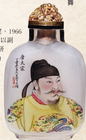
◆衡水內畫秉承「藝術品實用化 實用品藝術化」的理念, 將內畫融入現代生活。