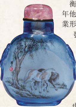
◆衡水內畫以龐大的創作隊伍、豐富的花色品種、高超的工藝水準, 熠熠生輝。

衡水內畫由中國工藝美術大師王習三創建, 1966年他從北京返回家鄉阜城縣楊莊村, 1967年以副業形式搞起內畫, 並不斷收徒傳藝, 創新研發。他發明了金屬杆勾毛筆, 開創內畫動物撕毛法及油彩內畫內河, 先後六批收徒, 傾囊相授, 培育內畫人才, 並形成了「立意深遠、構圖嚴謹、線描技法豐富、設色協調精潤、書畫並茂、雅俗共賞」的藝術風格, 被國際收藏界和藝術研究界稱為冀派內畫, 也稱衡水內畫。