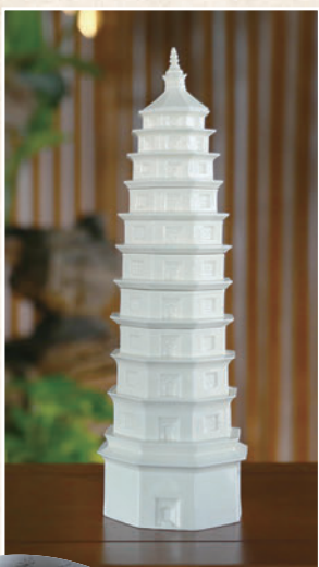
◆寶塔茗香——將定州的歷史名勝古跡與定州的非遺文化用禪茶的精神相融合創造的作品。