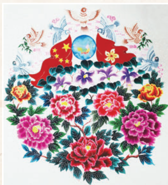
◆蔚縣剪紙新穎、艷麗, 逼真美觀。

蔚縣剪紙是河北省蔚縣地方傳統手工剪紙技藝, 國家級非物質文化遺產之一。其剪紙題材廣泛, 寓意深長, 生活氣息濃厚。體現了民間藝人高超的智慧和豐富的想像力, 散發着淳樸華美的藝術魅力, 美輪美奐, 無疑有着重要的藝術價值。