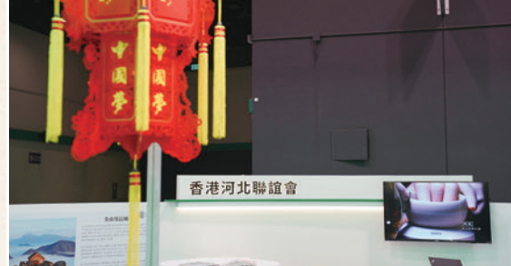
◆宮燈多次走向世界級舞台, 成為河北省的名片。