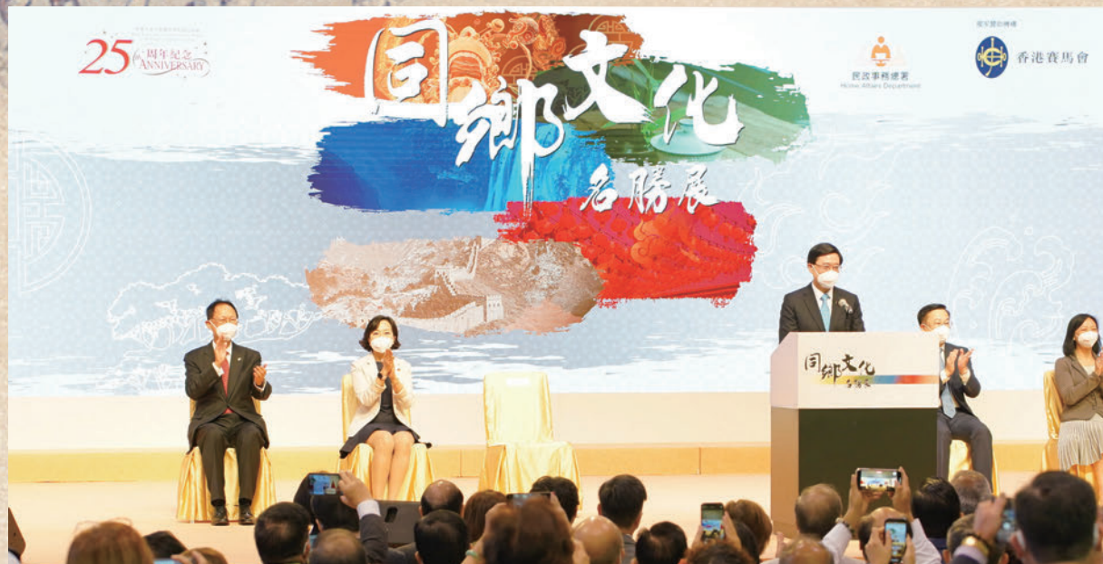
◆行政長官李家超出席「同鄉文化名勝展」開幕典禮並致辭。