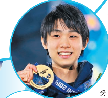
◆2014年索契冬奧會，羽生結弦贏得首個奧運金牌。

羽生結弦昨天在東京一家酒店舉行的發布會上宣布了引退的決定，這位今年27歲的花滑傳奇深鞠一躬後說：「感謝大家迄今一直支持我。因為有大家的支持，才能成就花滑選手羽生結弦。今後我將不再與其他選手競技，但將繼續作為職業花滑選手努力。」與足球或籃球等高度職業化的運動不同，花滑「職業」選手更多象徵是臨近運動生涯的狀態，更傾向於職業表演的選手性質，而事實上參加最高等級國際賽的花滑選手是被稱作「業餘」運動員。