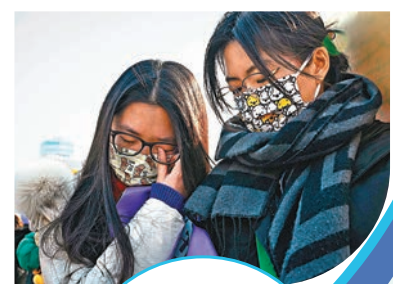
◆在北京冬奧會，相信羽生已完奧運最後一滑的粉絲們，紛紛激動落淚。

被指笑容充滿治愈力的羽生，成功贏得不少粉絲的心，難怪有粉絲在他將宣布退役的消息傳出後曾表示不敢置信，「想聽到羽生結弦本人親口說」才能相信現實。