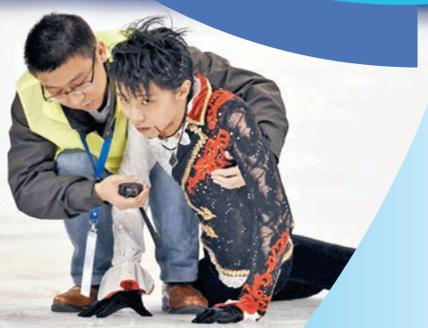
◆羽生結弦(右)2014年在中國盃中下領被劃破，血灑賽場。

2010年，小四的他第一次參加全日本少年錦標賽就拿到金牌，到17歲首次出戰世界錦標賽。然而2011年，日本發生了311大地震，當時因為災區滑冰場都無法使用，震災發生10天後，身為受災戶的羽生和母親搭巴士前往橫濱，繼續滑冰練習；之後他也參加義演活動為災區募款盡心力。 經歷大地震的羽生展現堅強韌性，在2011年首度奪下花滑大獎賽