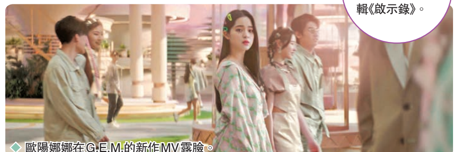
◆ 歐陽娜娜在 G.E.M. 的新作 MV 露臉。