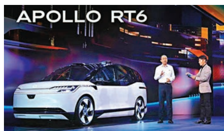
◆百度發布Apollo RT6。

香港文匯報訊(記者 張聰、朱熾) 昨日在線上召開的2022百度世界大會上，百度最新AI技術成果集中亮相，並發布無方向盤無人車Apollo RT6，成本為25萬元人民幣。百度創始人、董事長兼首席執行官李彥宏表示，基於自動駕駛技術的重大突破，Apollo RT6成本降低為業界的10%，並稱Apollo RT6將於2023年率先在「蘿蔔快跑」上投入使用。「基於無人車成本的降低，未來打無人車要比現在打車便宜一半。」