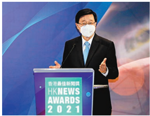
◆李家超勉勵香港報界繼續重視專業化發展，做到「專益求專」。

由香港報業公會主辦的「2021年香港最佳新聞獎」昨日舉行頒獎典禮，香港大公文匯傳媒集團旗下3份報章共獲得23個獎項，再居全港報業集團之首，並創集團歷年最好成績（見表）。其中，香港《文匯報》奪得10個獎項，包括最佳科學新聞冠軍、最佳新人亞軍、最佳標題亞軍和季軍、最佳文化藝術新聞季軍，以及5個優異獎；《大公報》獲得3冠2亞1季4優異獎；《香港仔》獲得2亞1優異獎。主禮嘉賓、香港特區行政長官李家超在頒獎典禮致辭時勉勵香港報界繼續重視專業化發展，做到「專益求專」，一起建設香港未來，一起說好香港故事，又表示近年有人假借新聞之名從事非法勾當，特區政府有責任依法打擊污染新聞工作的破壞分子，真正的新聞工作者也應與之保持距離。