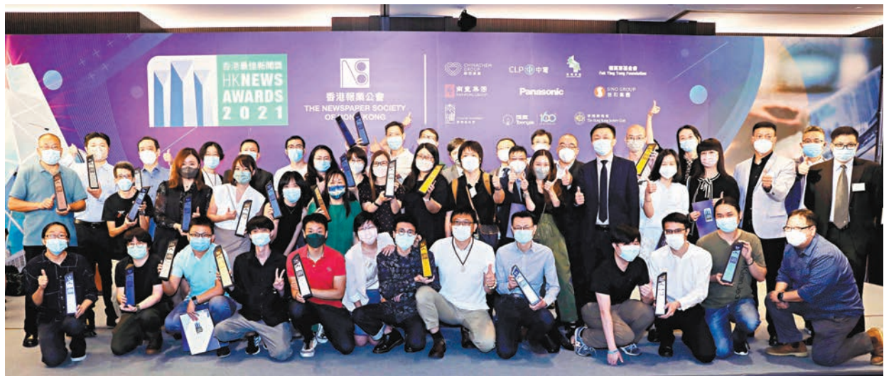
◆大公文匯傳媒集團囊括23個獎項，再居全港報業集團之首，並創集團歷年最好成績。