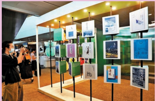
◆ 書展文藝廊「城市書寫·特選書目」展區，挑選了25本城市書寫特選書目。

今年香港書展的「文藝廊」中的「細味香港」展區展出了上世紀香港市民日常生活的舊物，主辦方展出餐牌、茶具、器皿、擺設、價目表及廣告等珍貴藏品，讓大家尋回滿載香港本地風味的集體回憶，一同細味香港。作家兼歷史愛好者鄭寶鴻的收藏品也在此展出，他接受《文匯報》記者專訪時分享了其收藏的往事。