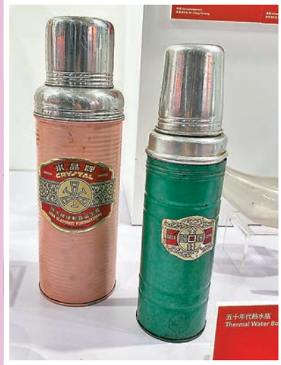
◆ 上世紀五十年代熱水瓶