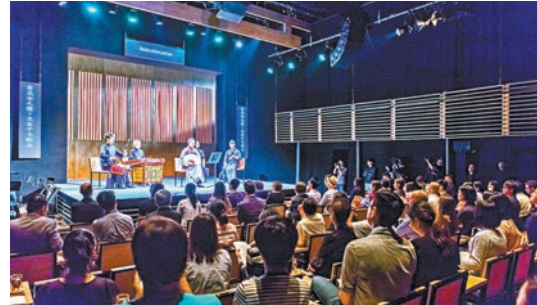
◆ 茶館劇場呈現舊時戲曲藝術於民間普及的茶館文化。