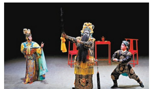
◆ 小劇場粵劇《霸王別姬》(新編)劇照。