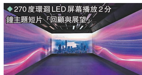
270度環迴LED屏幕播放2分鐘主題短片「回顧與展望」