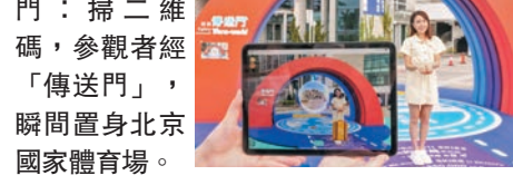
AR 傳送門：掃二維碼，參觀者經「傳送門」，瞬間置身北京國家體育場。