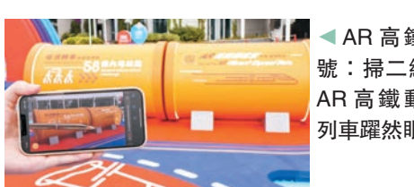
AR 高鐵動感號：掃二維碼，AR 高鐵動感號列車躍然眼前。

黃昏後，部分裝置更會亮起，當中有雲形鞦韆架（高3米）、門廊 Gateway、港珠澳大橋、模擬航天走廊無人駕駛運輸系統、壽司桌及機場第三條跑道等，大家在浪漫甜蜜的氛圍下，與摯愛及閨蜜一同體驗香港基建的發展成果。