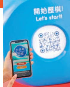
參觀者在起點掃描二維碼後即可在手機上進行遊戲。

首先，位於愛丁堡廣場的室外展「大未來歷棋」，佔地7,000呎，以大型棋盤遊戲形式設計，將互動科技元素引入輕鬆玩樂的棋盤遊戲，配合海、陸、空三方面基建及相關有趣知識，呈現香港作為國際門廊聯繫粵港澳大灣區及世界各地的重要角色。從展城館俯瞰棋盤，更會看到「25」字樣，以慶祝香港回歸祖國25載。場內設有共12個關於海、陸、空基建亮麗繽紛的實體裝置，造型趣致，當中展示趣味小知識，大家可與高3.5米的港珠澳大橋、高3.3米的門廊 Gateway 及可轉動的壽司桌合照，亦可坐上模擬航天走廊的無人駕駛運輸系統或貨櫃箱組合，或爬上高鐵或行李箱裝置內，selfie一番留念。