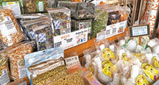
泰國花茶及草藥等