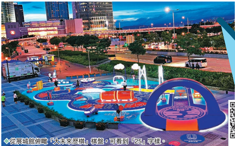
從展城館俯瞰「大未來歷棋」棋盤，可看到「25」字樣。