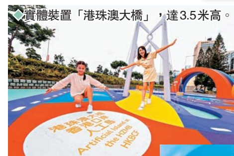
實體裝置「港珠澳大橋」，達3.5米高。