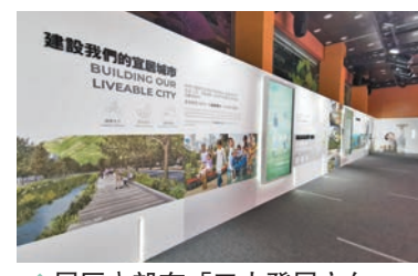
展區內設有「三大發展方向」