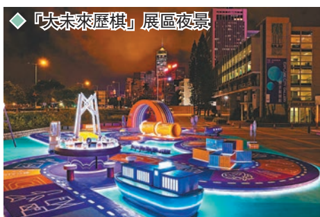
「大未來歷棋」展區夜景