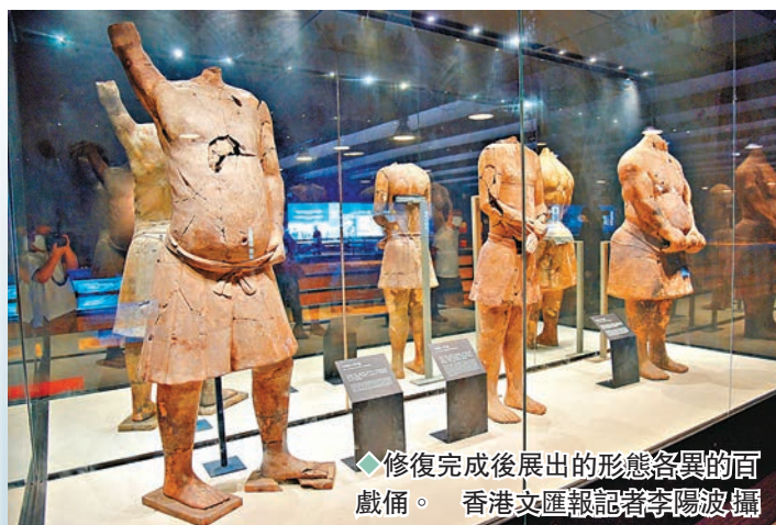
◆修復完成後展出的形態各異的百戲俑。