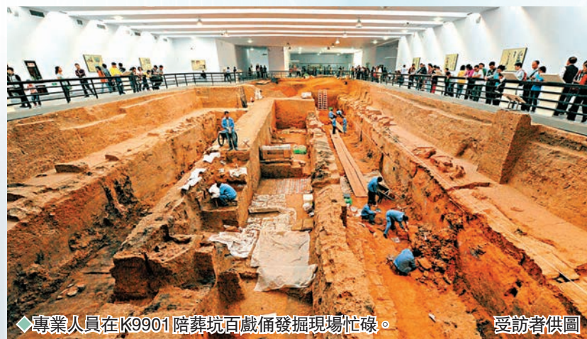
◆專業人員在K9901陪葬坑百戲俑發掘現場忙碌。