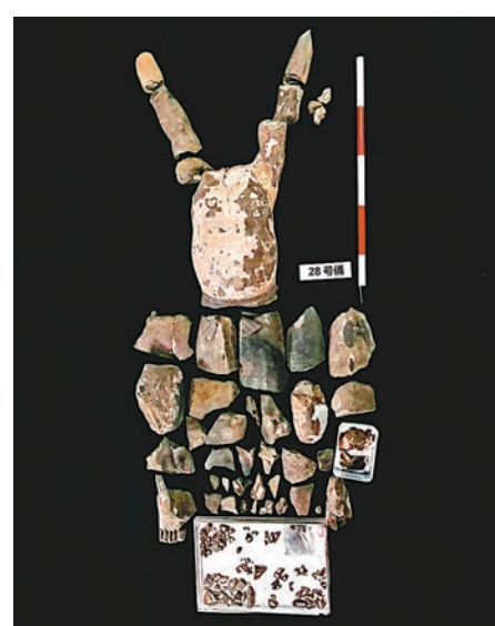
◆修復前的「仰臥俑」。「仰臥俑」出土時破損嚴重，除了上半身，剩下的幾乎是碎塊和碎片。

可能很多人都知道，兵馬俑在當初都是通體彩繪，只是埋藏地下歷經千年的水浸等自然侵害，彩繪大多脫落，只有部分殘存。而與大家通常看到的兵馬俑製作工藝不同的是，K9901百戲俑坑