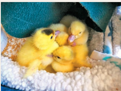
▶加拿大一些年輕人飼養小鴨，所需開支低過貓狗。

香港文匯報訊（特約記者成小智 多倫多報導）加拿大超過370萬人在新冠疫情期間新收養、購買或飼養寵物，但隨着通脹率持續上升至8.1%，很多人無法應付飼養寵物的開支大增，他們被迫把寵物送往各地的愛護動物組織。各地收容所對棄養動物數量飆升感到不勝負荷，尤其是現在面對物資供應緊張、人手短缺和動物身體狀況欠佳。收容所的營運環境普遍處於臨界點，可能需要政府提出援助紓緩困局。