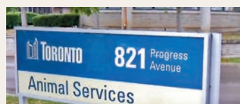
▲多倫多動物服務中心上半年接收的棄養動物，較去年同期激增。

經濟學家指出通脹壓力已對普羅大眾構成沉重壓力，百物騰貴令到他們不易維持本身生活開支，根本沒有多餘金錢飼養寵物。學者認為央行不斷加息壓抑通脹勢必觸發衰退，一般受薪階層擔心可能失業而開始勒緊褲頭，寵物變成最先被剔除的開支項目。動物收容中心負責