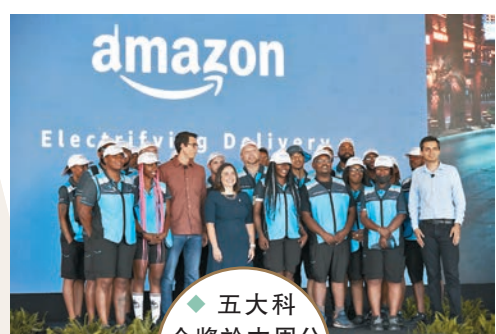
◆五大科企將於本週公布業績。 資料圖片

美國多家科技巨頭將在本周公布季度業績，在美國經濟可能陷入衰退的陰霾下，市場都關注科企業績會否對前景有所反映。事實上，不少科企近日都在暗示它們正面臨挑戰，較大型的科企紛紛宣布裁員或暫緩招聘，初創企業則表示難以獲得融資，Alphabet行政總裁皮猜亦直言，科技業界的「好日子已經過去」。