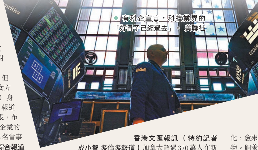
◆有科企直言，科技業界的「好日子已經過去」。