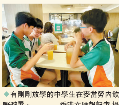
◆有剛剛放學的中學生在麥當勞內飲嘢避暑。

其後記者到附近一間快餐店，該店於入口處貼出一張「冷氣故障」的告示，不過即使有故障，店內仍涼快，