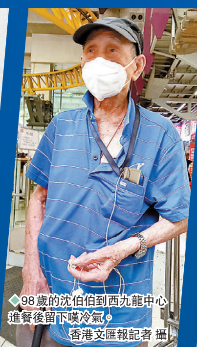
◆98歲的沈伯伯到西九龍中心進餐後留下嘆冷氣。