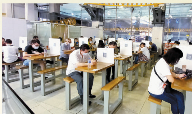
◆西九龍中心食肆區內有市民嘆冷氣。 香港文匯報記者攝

香港文匯報訊（記者張弦）有冷氣開放的食肆成為基層市民的避暑勝地，甚至變成另類「託兒中心」。香港文匯報記者昨日查訪多間食肆及快餐店，遇見不少中小學生及長者懶理食肆播疫風險，長時間在食肆「打躉」及嘆冷氣，更有小學生甫放學便被父母帶到快餐店做功課。有職員向記者表示，近日「麥離民」人數有所增加。