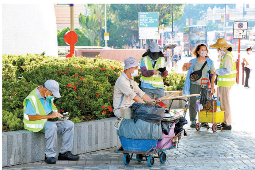
◆社協建議特區政府在酷熱天氣下為戶外勞工提供高溫津貼。

他指出，其實要減低工人中暑機會，應規管高溫工作指引，例如結合氣溫和濕度訂立指標，估計氣溫達35度便規定要讓工人暫停工作。