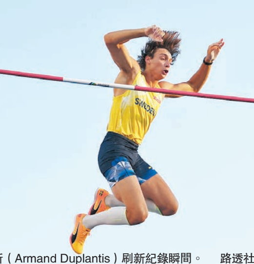
◆杜普蘭蒂斯(Armand Duplantis)刷新紀錄瞬間。