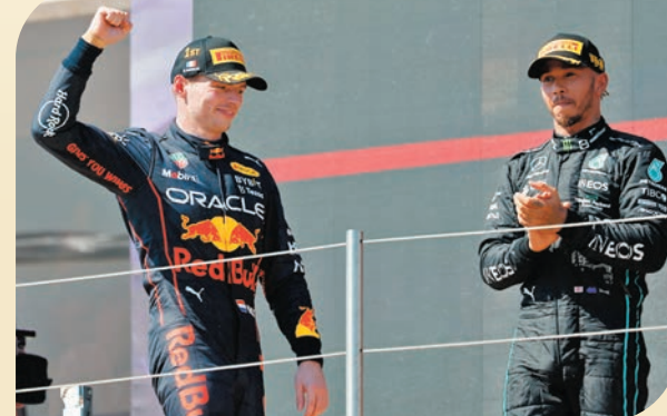
◆韋斯達資全力壓咸美頓奪冠。

綜合新華社報道 世界一級方程式賽車錦標賽(F1)法國大獎賽當地時間24日在列卡德賽道展開正賽，法拉利車手勒克萊在領跑位置撞車，紅牛車手韋斯達資利用安全車機會取得領先並輕鬆奪冠，咸美頓在F1生涯第300場大獎賽中拿到亞軍。 頭位發車的勒克萊開賽後保持對第2名韋斯達資的微弱優勢，第17圈後者進站換上硬胎，出站後位列第7名。僅一圈後，勒克萊在11號彎側滑，隨後賽車失控滑出賽道撞上路障，賽會出示黃旗並出動安全車，大量尚未進站的車手選擇進站更換輪胎，韋斯達資借機上升到領跑位置。 隨後比賽，韋斯達資和咸美頓在前兩名位置輕鬆領跑。僅剩四圈時，周冠宇賽車故障引發虛假安全車。兩圈後比賽恢復，平治車手羅素抓住機會超越佩雷斯鎖定第3名，韋斯達資及咸美頓分奪冠、亞軍。12站比賽過後，韋斯達資以233分領先170分排第2的勒克萊，續居車手積分榜頭名。