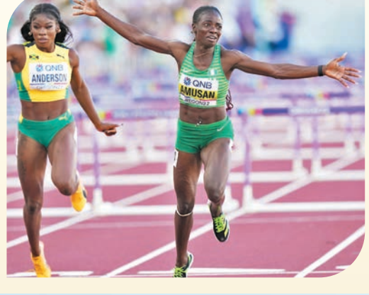
◆阿姆桑(Tobi Amusan)(右慶祝)歷史時刻。新華社

綜合新華社報道 兩項新世界紀錄在昨天誕生，為2022年俄勒岡田徑世錦賽收官。尼日利亞選手阿姆桑創造了12秒12的女子100米欄新世界紀錄；瑞典名將杜普蘭蒂斯則以6米21的成績，將他自己保持的男子撐竿跳高世界紀錄提高了1厘米。 女子100米欄在準決賽便爆出驚喜。阿姆桑在第一組跑出12秒12，刷新了此前由美國選手哈里森保持的世界紀錄。而在不到兩小時後的決賽裏，她再度跑出12秒06的驚人成績。但決賽風速為順風2.5米/秒，為超風速的比賽環境，因此阿姆桑的決賽成績沒有被認定為世界紀錄。 男子撐竿跳賽前也被視為有可能創造新紀錄的項目之一。決賽中，東京奧運會冠軍杜普蘭蒂斯依舊「獨孤求敗」。躍過6米橫杆後，他便提前將個人首枚世錦賽金牌收入囊中，接着他開始了對6米21的衝擊，目標是打破自己今年3月在貝爾格萊德世界室內錦標賽上創造的6米20世界紀錄。 杜普蘭蒂斯第一次試跳並未成功，迎來的是觀眾失望的嘆息。他之後冷靜下來，躍過橫杆，讓奇跡發生在世錦賽的最後一刻。這是杜普蘭蒂斯第5次打破世界紀錄，從6米17到6米21，這位22歲年輕選手一厘米一厘米地向上挑戰天空的極限。