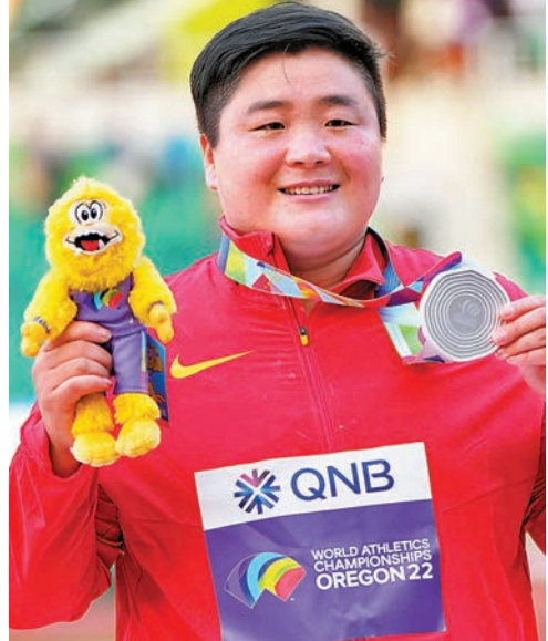
鞏立姣成績已有交代。