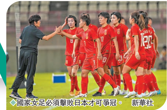
國家女足必須擊敗日本才可爭冠。

香港文匯報訊(記者楊浩然)在日前東亞盃盃賽和韓國的中國女足，將於今日黃昏時間出戰最後一輪比賽，對手為日本女足。國家女足目前以兩戰得4分排次席，落後兩戰全勝得6分的日本，因此國家隊是役必須擊敗對手，才可於分數上壓過對手贏得冠軍。(港台電視32今晚6:20p.m.直播)至於韓國則會於今日較早時候對戰中國台北。(港台電視32今晚3:00p.m.直播)