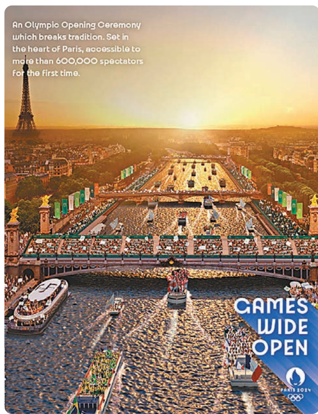
An Olympic Opening Ceremony which breaks tradition. Set in the heart of Paris, accessible to more than 600,000 spectators for the first time.