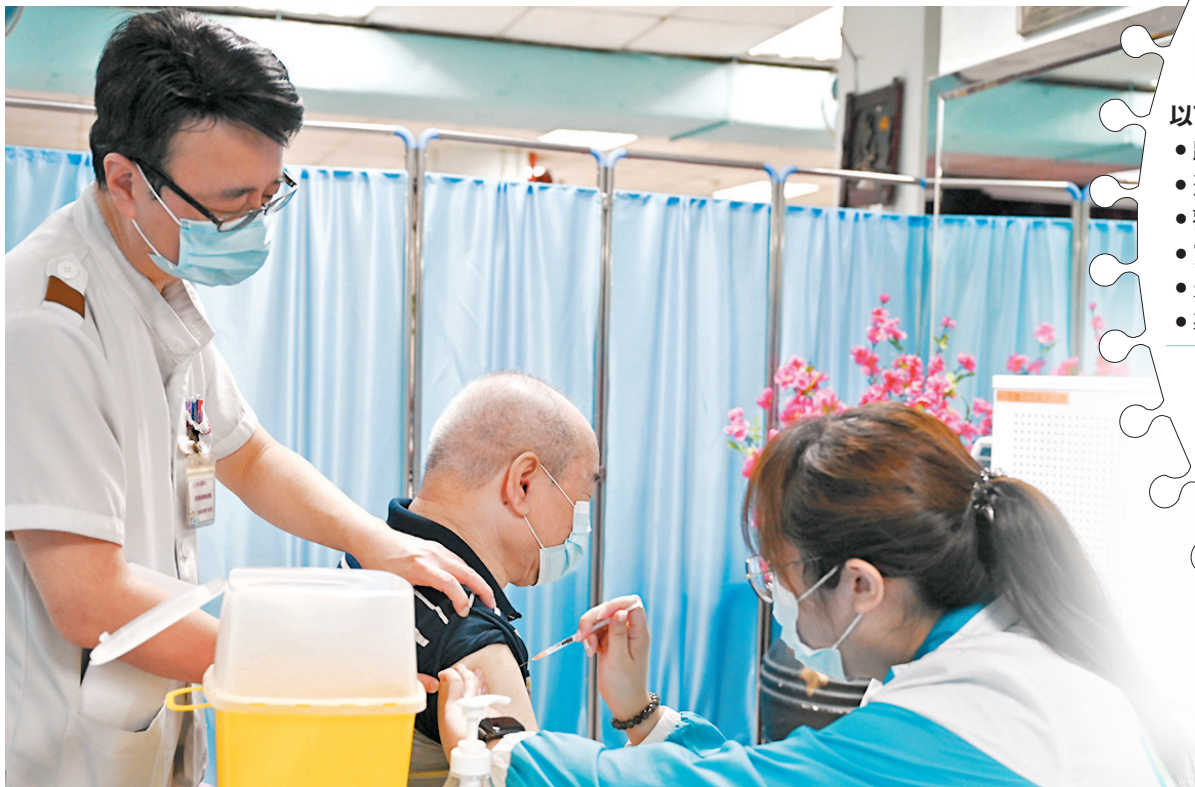
◆衛生防護中心呼籲長者、有長期病患等高風險人士盡早打齊疫苗。圖為早前踴躍接種疫苗的長者。