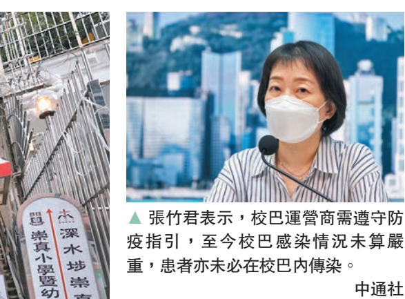
▲張竹君表示, 校巴運營商需遵守防疫指引, 至今校巴感染情況未算嚴重, 患者亦未必在校巴內傳染。

同時, 每次接載完乘客後, 司機或保母只要有時間都會再用漂白水濕毛巾擦乾淨車內, 既保護司機及員工, 也能保護乘客。戴好口罩等更加做到十足, 即使有些小朋友一時興起拉下口罩, 隨車的保母也會立即要求學童戴好口罩。「小朋友們其實也都很了解疫情