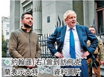
◆約翰遜(右)當到訪烏克蘭表示支持。