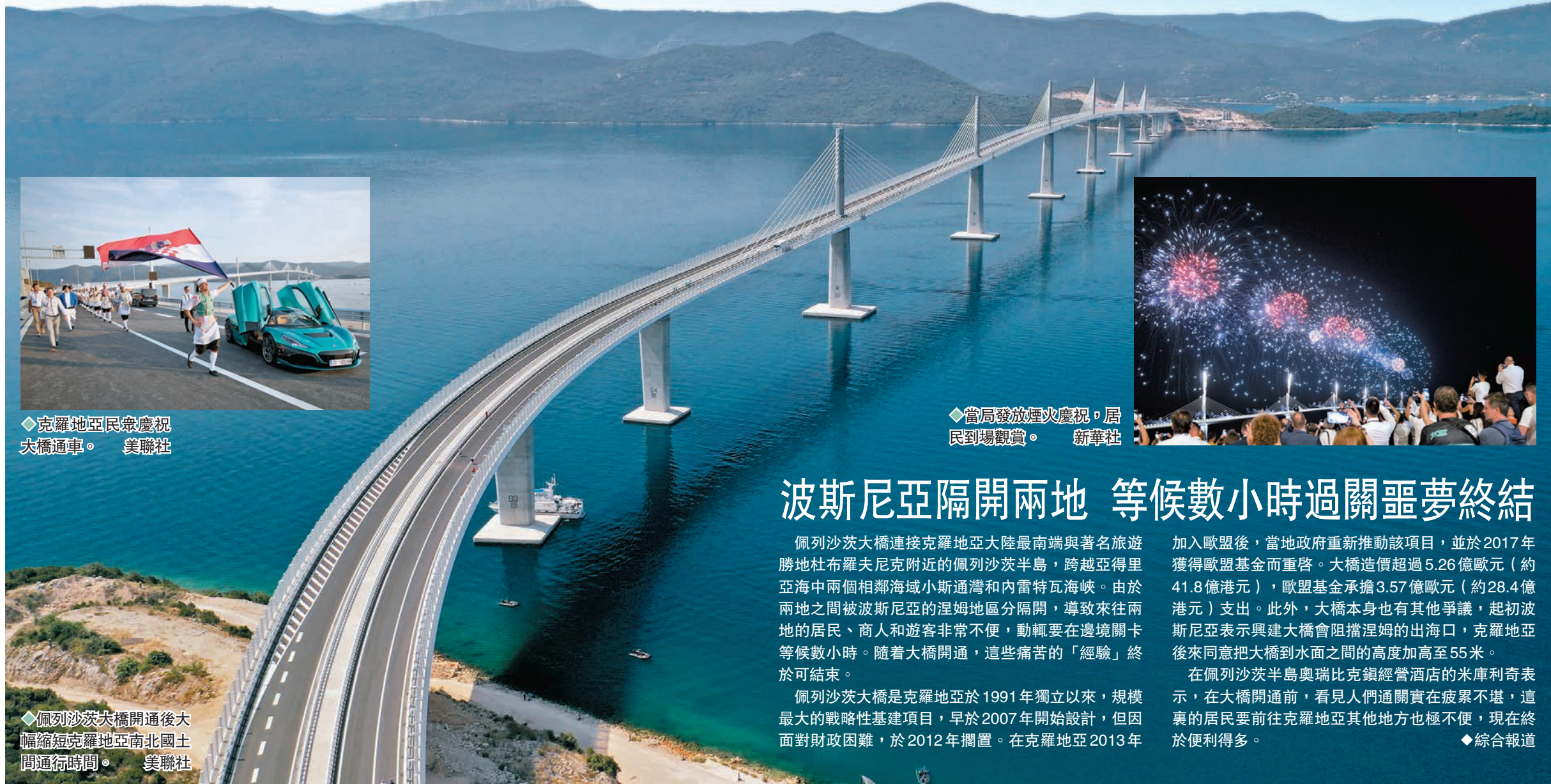
◆克羅地亞民眾慶祝大橋通車。