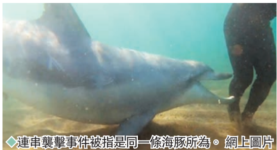
◆連串襲擊事件被指是同一條海豚所為。 網上圖片