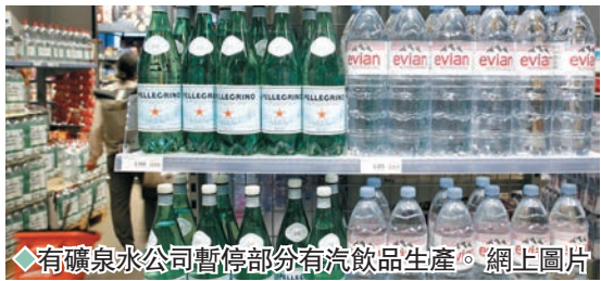
◆有礦泉水公司暫停部分有汽飲品生產。