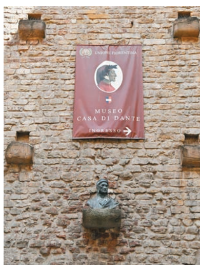
◆但丁故居博物館外的但丁雕像

但丁是意大利中世紀著名詩人、歐洲文藝復興時代的先驅之一，以《神曲》、《新生》等代表作聞名於世。在他的故鄉佛羅倫斯，到處可以尋覓到但丁的「身影」，就是矗立在聖十字大教堂前的但丁雕像、但丁故居博物館，再到但丁的著作和相關紀念品，無處不凸顯這位意大利文豪與城市的深刻淵源。