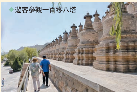
◆遊客參觀一百零八塔