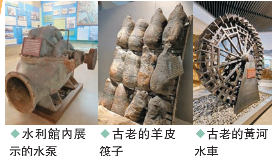
◆水利館內展 示的水泵