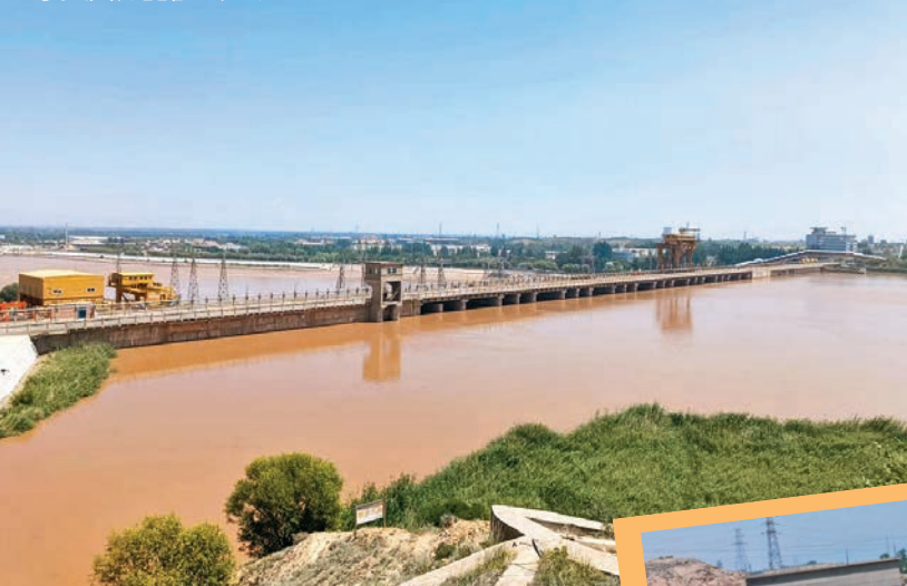
寧夏黃河古灌區全貌