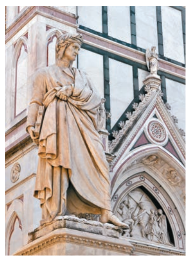
◆聖十字大教堂外的但丁雕像