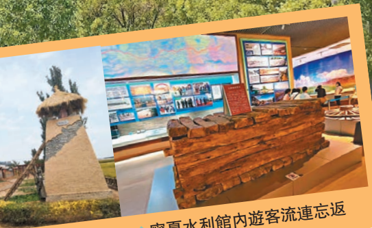
◆寧夏水利館內遊客流連忘返

景區具有國家和世界級的景觀風貌，以及內地罕見的地質構造，文化底蘊深厚、資源組合度強、生態保護完整，是保護傳承弘揚黃河文化精神家園