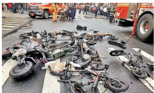
◆紐約今年已發生166宗電動單車鋰電池過熱起火事故。

單車諮詢公司Human Powered Solutions創辦人弗里茨表示，質素差的鋰電池是大部分起火意外的主因，又指因鋰電池引起的火災幾乎無可能靠一般人撲滅，只能盡力阻止火勢蔓延，或任由燃料耗盡，強調用家需在電池充電期間保持警覺。◆綜合報道