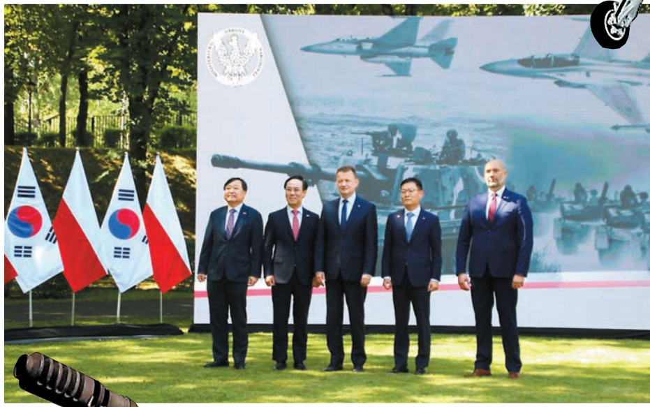
▲韓國軍工企業代表團在華沙與波蘭國防部代表簽署採購合約。

分析指出，韓國軍備出口並不是一味靠平，而是在於能夠提供全套售前售後服務，包括貸款、彈性還款期、技術轉移，甚至是國防以外的投資及工業合作，對於發展中國家而言非常吸引。事實上，近年很多亞洲發展中國家都以往購買俄製或美製軍備，改為購買韓國貨。此外，韓國政府為推動軍備出口不遺餘力，上至總統府及各部門，下至駐外武官、國營銀行及研發機構都參與其中，政府亦非常鼓勵軍工企業參與各大軍備展覽，分析指出，這點正是韓國比起最大競爭對手日本優勢之處。◆綜合報道