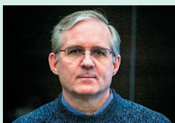
◆俄羅斯指控惠蘭從事間諜活動並拘留他。