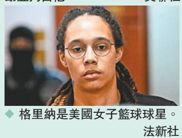
◆格里納是美國女子籃球球星。