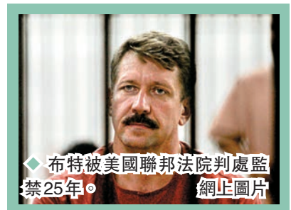
◆布特被美國聯邦法院判處監禁25年。

俄方表示，惠蘭是在2018年底於莫斯科從事間諜活動時被拘留，他因間諜罪在俄羅斯被判處16年監禁。格里納則於今年2月乘飛機從紐約抵達列梅捷沃機場時被捕，工作人員在她的手提行李中發現了液體氣味特殊的電子煙，經鑑定是大麻油，罪成最高可判監10年。◆綜合報道