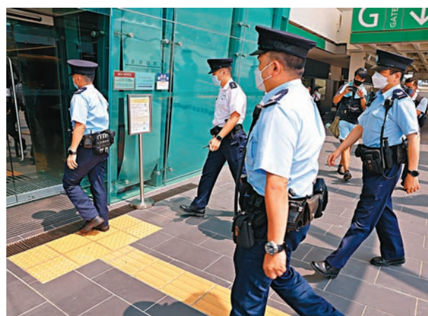
◆警方昨日繼續封鎖紅磡體育館意外現場。香港文匯報記者 攝

有舞台製作及管理業內人士表示，舞台搭建前表演者已在排練，「要on stage綵排，則舞台要先完成搭建，音響、燈光等所有東西已做好」，他指出現時不少表演也只得一兩天台上綵排時間，讓表演者熟悉舞台，當然舞台設計繁雜就有較大風險，但他認為最重要仍是裝置符合安全標準，如升降台曾出現震動，反映機械有技術問題，而舞台邊緣位置應貼上熒光帶以提醒表演者，避免失足。