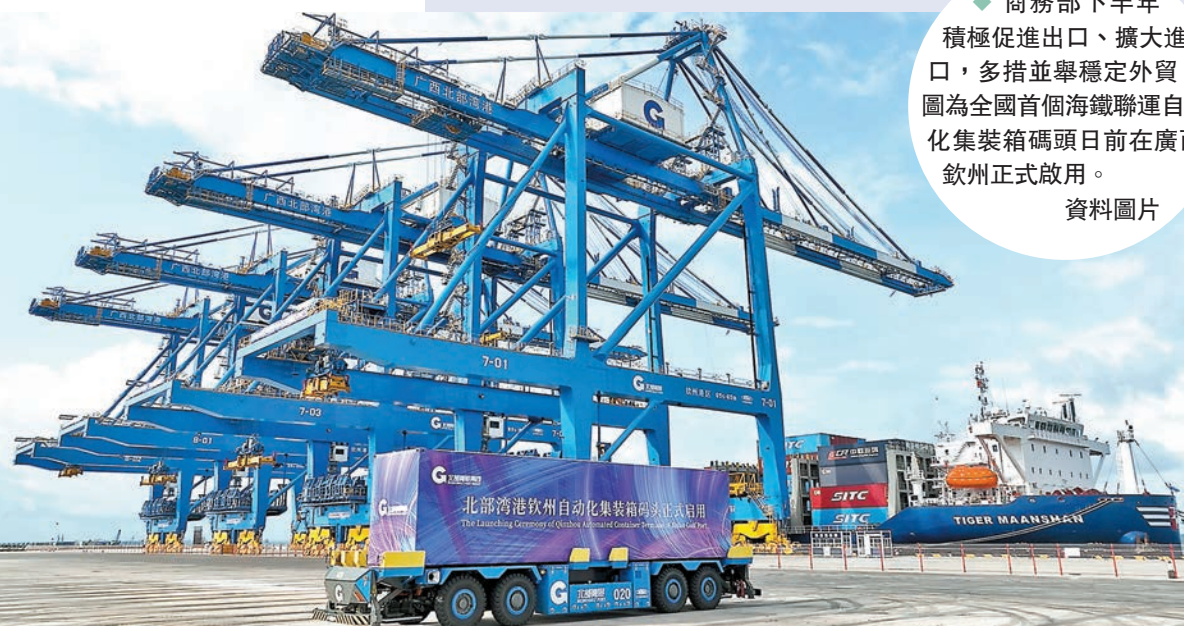
◆商務部下半年積極促進進出口、擴大進口，多措并举穩定外貿。圖為全國首個海鐵聯運自動化集裝箱碼頭日前在廣西欽州正式啟用。資料圖片

張斌指，三是強保障。商務部將指導各地加大下半年穩外貿工作力度，穩定中小微外貿企業預期，支持外貿企業降成本。加強與相關部門的協同配合，形成穩外貿工作合力。及時掌握外貿領域的新情況、新問題，研究推動出台針對性舉措。擴大進口，保障大宗商品國內供給。加大國家進口貿易促進創新示範區培育力度。