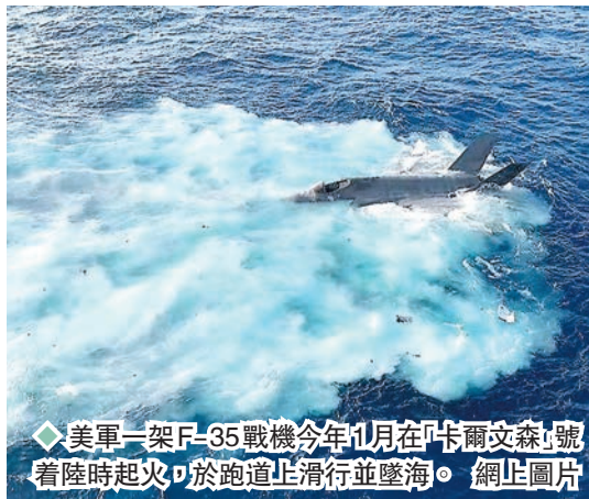
◆美軍一架F-35戰機今年1月在「卡爾文森」號著陸時起火，於跑道上滑行並墜海。