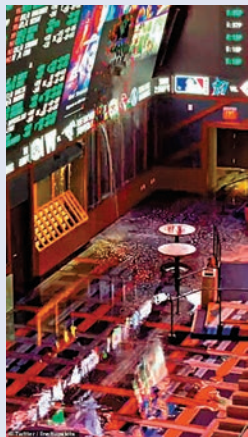
▲賭場的天花板漏水如瀑布傾瀉而下。網上圖片