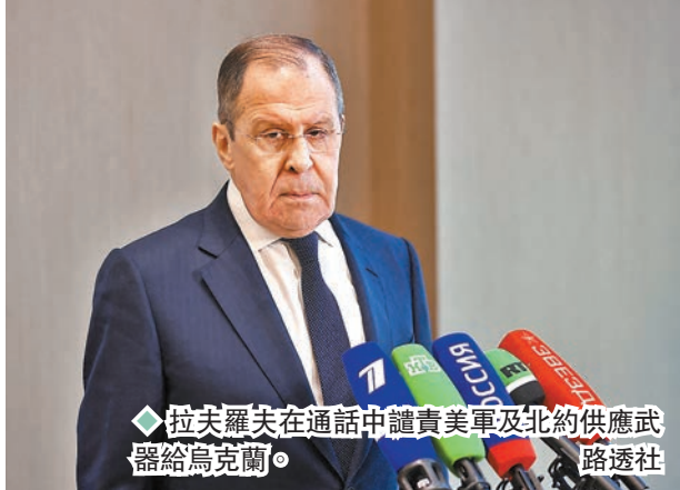
◆拉夫羅夫在通話中譴責美軍及北約供應武器給烏克蘭。