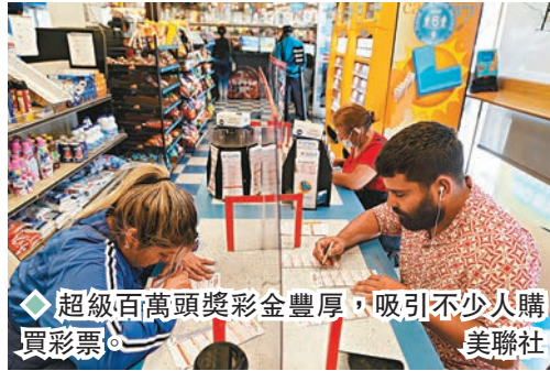
◆超級百萬頭獎彩金豐厚，吸引不少人購買彩票。美聯社