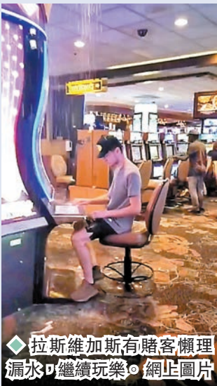
◆拉斯維加斯有賭客懶理漏水，繼續玩樂。網上圖片

的電燈停電；據當地報章報道，逾7,000名客人上周四晚上10時後斷電。 拉斯維加斯消防救援局在Twitter表示，該局接獲330個求助電話，消防員已將7名受洪水圍困的人救出。當地前日上午天氣好轉，多地供電系統已修復，懸掛在步行區的大熒幕也重新開機，賭場活動大多已復常，許多賭場業者考慮進行必要修繕，以防範未來出現類似事件。