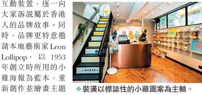
裝潢以標誌性的小雞圖案為主軸。

今次展覽裝潢以其標誌性的小雞圖案為主軸，外牆壁畫設計以具有歷史意義的「三隻小雞」宣傳海報加以變奏，藝術家Leon以蔚藍天空和棉花雲為背景，透過小雞們歡欣嬉戲的畫面，寓意彼此相伴，向大家傳遞正能量。