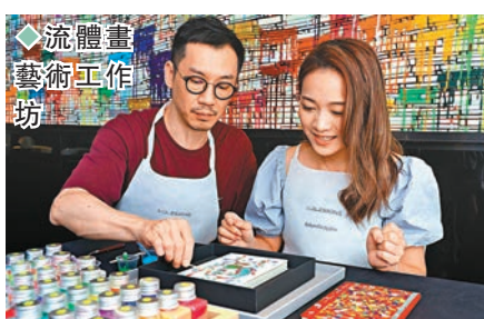
流體畫藝術工作坊。

而且，這個設計令限定店可因應不同的活動而作出巧妙調配，亦可隨時化身成為活動場地，提供多元化的專屬體驗。