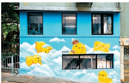
一幅8呎高壁畫是打卡好去處。

近年，不少品牌為大家提供創新購物體驗，當中包羅了藝術元素，讓大家置身其中，即可感受一下創新藝術感覺，同時亦可品嚐特色咖啡，實行跨越界限的零售創藝空間，讓大家在購物的時候，也可以放鬆心情。