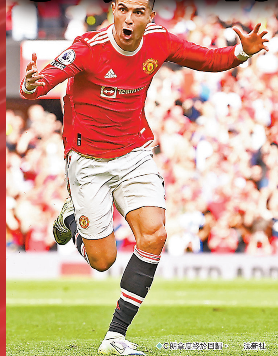
◆C朗拿度終於回歸。

希望於今夏離開曼聯，以出戰歐聯比賽的C朗拿度由於依然乏人問津，令這名葡萄牙球星來季去向增添變數。缺席了多場熱身賽的他早前終於向曼聯報到，更表明今晚會在對華歷簡奴的友賽中披甲上陣，或成為C朗拿度最終選擇留隊的啟示。(now640台今晚11:00p.m.直播) ◆香港文匯報記者 郭正謙