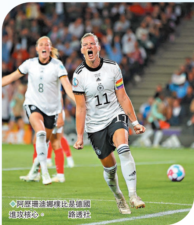
◆阿歷珊迪娜模比是德國進攻核心。