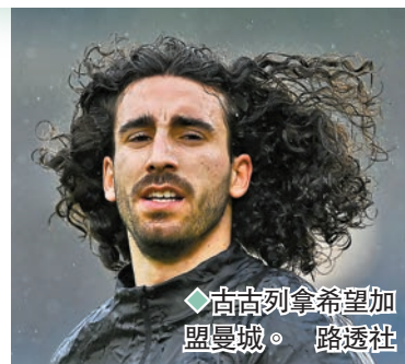
◆古古列拿希望加盟曼城。