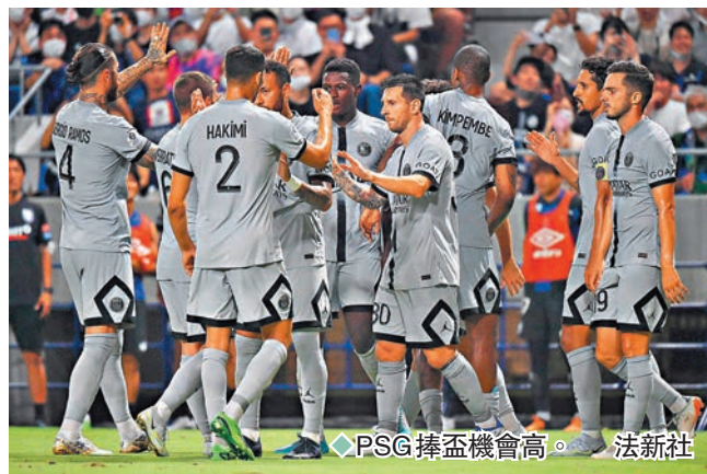
◆PSG捧盃機會高。

格；只是球隊今夏卻有上季首席神射手高路梅安利以自由身轉投法蘭克福，但南特至今卻仍未找到其替代人選，就算中場加入了前紐卡索、屈福特中場老將穆沙施素高，予人感覺整體戰鬥力仍是減無增，面對大超班的PSG，相信難有爆冷獲勝機會。