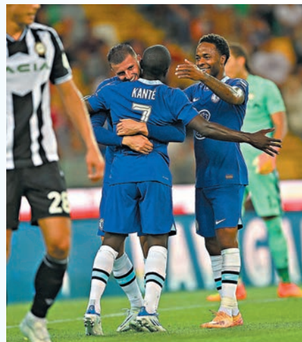
◆車路士表現有改善。

另一方面，仍於美國的皇家馬德里，將於今日早上和祖雲達斯進行友賽（無線myTV Super App今日10:00a.m.直播）。