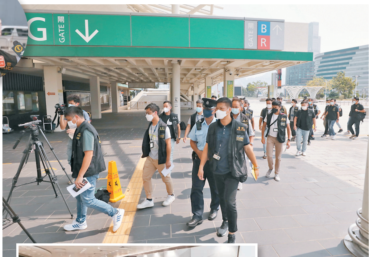
西九龍刑事部探員及化驗師再到紅館MIRROR演唱會場館調查及蒐證。