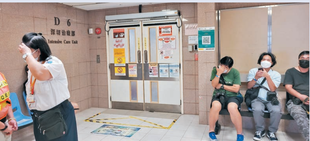
昨日守候在伊利沙伯醫院深切治療部外的傳媒未見阿Mo父母出入。

消息指，由於第四頸椎影響人體的手腳活動，若脊髓神經線斷裂受損嚴重而未能復原，最壞情況下不僅下半身癱瘓，亦有可能連手部活動能力亦喪失，而這類傷患因需等待神經線復原，傷者一般需面對極之漫長的康復之路。